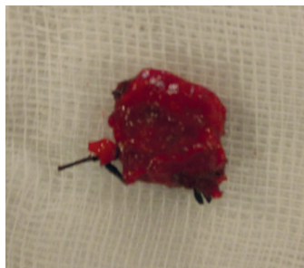
Figure 3 Segmento arterial ressecado, correspondendo ao pseudoaneurisma identificado