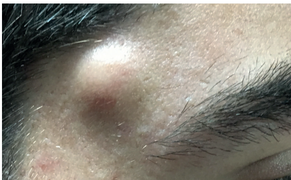
Figure 1 Tumefacção pulsátil da região fronto-temporal direita

Jovem do sexo masculino, 18 anos, recorre ao serviço de urgência por apresentar massa palpável e indolor da região fronto-temporal direita com crescimento recente e agravamento nos últimos dias.