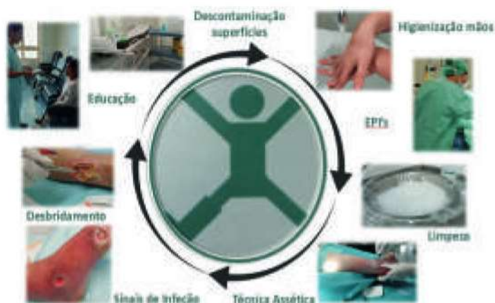
Fig. 1 Bundle care no Controle de Infecção no Tratamento de Ferida Complexa. Jorge, H. e Pinto, C., 2019.