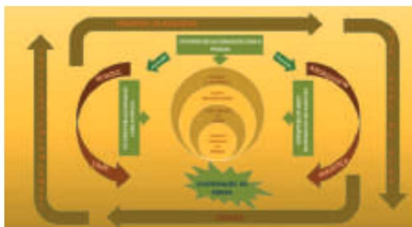
Fig. 2 Construção esquemática do Paradigma Atual no Tratamento de Feridas. Jorge, H, 2019.

preocupação na comunicação efetiva entre os diferentes intervenientes, numa estrutura de serviço de referência (20) , com organização de Nivel III (21) , com profissionais de saúde com conhecimentos e competências diferenciadas nesta área, nomeadamente o gestor de ferida, com capacidade de prescrever a melhor prática no sentido da prevenção/diagnóstico/decisão terapêutica na ferida crónica, complexa e/ou de difícil cicatrização ou seja o profissional de saúde mais bem capacitado para o desempenho deste papel (22) e tendo em conta um processo holístico, com a avaliação das necessidades da pessoa portadora de ferida por forma a colocá-la no centro dos cuidados e a valorizar o seu bem-estar e qualidade de vida. (Fig.1)