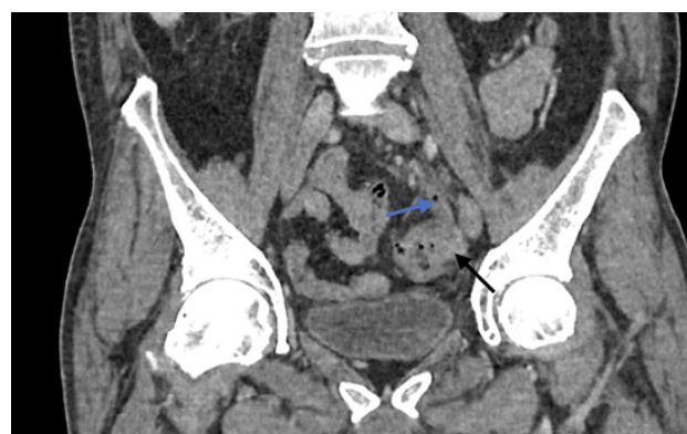
Figura 1 – Reconstrução coronal em fase venosa com diverticulite (seta preta) e preenchimento heterogéneo com bolha gasosa associada da veia mesentérica inferior (seta azul)

A etiologia reportada mais frequentemente para pileflebite é a diverticulite, seguida de apendicite, colecistite, pancreatite e outras infeções intra-abdominais, ocorrendo com maior