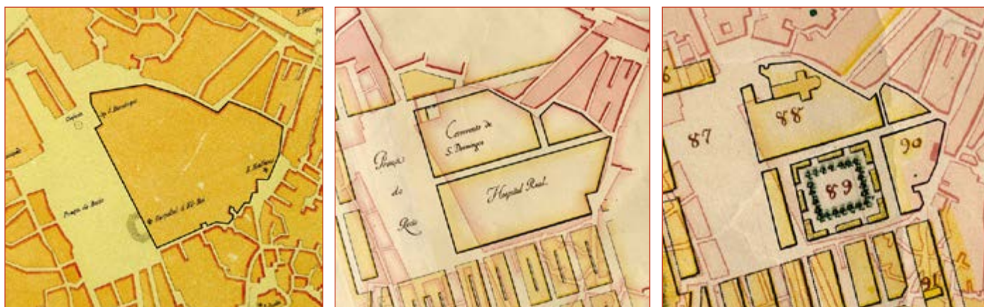
Figura 9 Marcação do limite da Ilha sobre a cartografia 1650, 1756, 1780. CML, Lisboa Interactiva . http://lxi.cm-lisboa.pt/lxi/ .

A sua transferência em 1775 e a supressão do Convento de São Domingos em 1834 alteraram tão profundamente o urbanismo deste local que hoje é difícil perceber a real dimensão e limites da Ilha em que estava edificado o Hospital Real de Todos os Santos . Desfragmentada em arquipélago 107 , este espaço tem sido um contínuo de transformações de usos e vivências, numa sobreposição de camadas ao longo dos últimos 3000 anos, tendo a Ilha constituído o mais icónico destes muitos estratos.