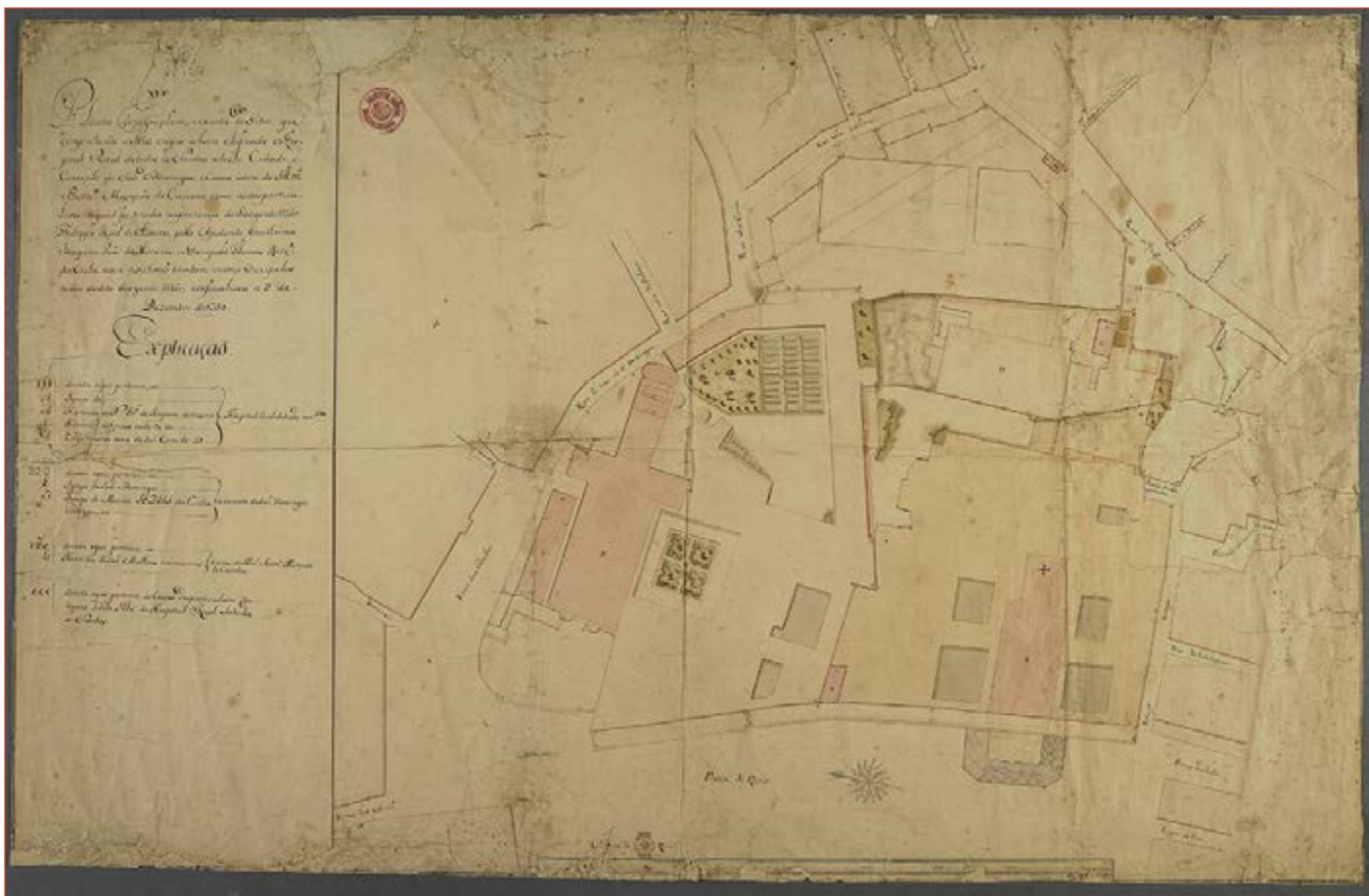
Figura 3 Planta Topographica, e exacta do Sítio, que comprehende a Ilha em que estava edificad o Hospital Real de todos os Santos desta Cidade; o Convento de São Domingos, e Cazas assim do Ilm o e Exm o Marquês de Cascais[...]. Filipe Rodrigues de Oliveira, 1750. Biblioteca Nacional de Portugal, http://purl.pt/22488 .

A forma sequencial como, em pouco mais de uma semana, todas as escrituras de aquisição foram assinadas (pelo exato valor da avaliação) reflete um processo solidamente conduzido que, ainda assim, encontraria dificuldades na resolução da aquisição do mencionado palácio (pertença do Marquês do Lourical, o então representante da Casa de Cascais), peça-chave na concretização deste ambicioso plano. Decorreriam mais de dois anos até à assinatura da escritura de venda deste edifício (a 27 de setembro de 1754), uma vez mais pelo valor da avaliação, 48:000$00. Contrariamente às demais propriedades, a compra foi feita pela