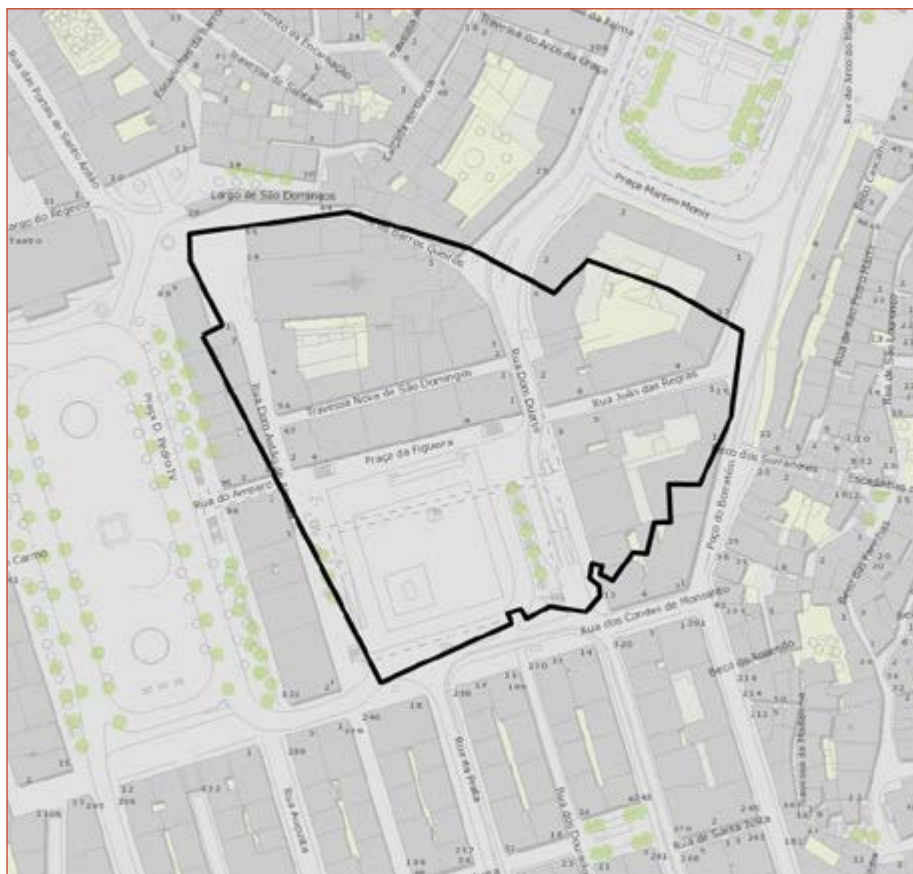
Figura 1 Marcação do limite do quarteirão do Hospital de Todos-os-Santos, Convento de São Domingos de Lisboa e Palácio dos Marquês de Cascais, sobre cartografia atual. Câmara Municipal de Lisboa (CML), Lisboa Interactiva . http://lxi.cm-lisboa.pt/lxi/ .

O lugar tomado como objeto no presente estudo é o grande quadrilátero cujo perímetro, em traços gerais, é atualmente delimitado pela Praça D. Pedro IV ( do Rossio ) e ruas de Barros Queiroz, Dom Duarte, João das Regras, do Poço do Borratém, dos Condes de Monsanto e da Betesga (Figura 1): A Ilha em que estava edificado o Hospital Real de todos os Santos desta Cidade; o Convento de São Domingos, e Casas assim do Ill.mo e Ex.mo Marquês de Cascaes 2 .