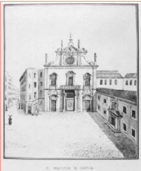
Figura 6 Igreja e Convento de São Domingos. Pereira, Luis Gonzaga, Monumentos Sacros de Lisboa em 1833 . Fotografia Estúdio Mário Novais, 1960. Arquivo Municipal de Lisboa, PT/AMLSB/CMLSBAH/PCSP/004/MNV/001203.