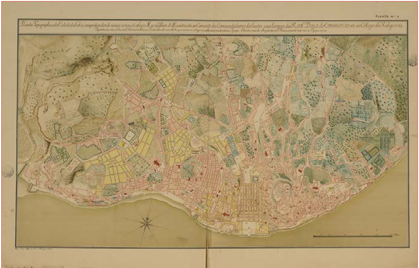
Figura 8 Planta topográfica da cidade de Lisboa, compreendendo na sua extensão a beira Mar da Ponte [...]. In SILVA, Augusto Vieira da – Plantas Topográficas de Lisboa , Planta n.º 4. Arquivo Municipal de Lisboa, PT/AMLSB/CMLSB/UROB-PU/11/398.

O monarca justifica esta opção com o dever de fazer “prevalecer a todo o interesse particular, o da Causa Pública” 101 , garantindo ao Hospital Real a compensação de poder continuar a edificar casas no terreno junto ao Convento de São Camilo de Lelis que, agora voltado à nova praça, ganharia uma acentuada valorização. Não obstante, parece ser insuficiente para compensar a perda de potenciais rendimentos causada pela alienação dos três quarteirões que deixaram de ser construídos. A “Praça Nova”, como então foi sendo chamada, ficava assim maioritariamente encerrada por edifícios conventuais (ou de posse conventual), encartulando-se também a sua face poente, onde se encontrava o convento dos padres camilos.