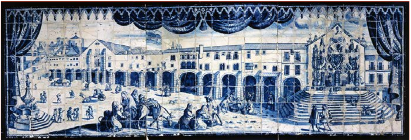
Figura 2 Hospital Real de Todos os Santos , painel de azulejos. Mestre P.M.P. (atribuído), séc. XVIII (1.º quartel). Museu da Cidade, MC.AZU.74.

Seriam estas a configuração e a implantação que o Hospital Real de Todos-os-Santos manteria durante pouco mais de dois séculos e meio, tornando-se num dos mais icónicos referentes da Lisboa moderna.