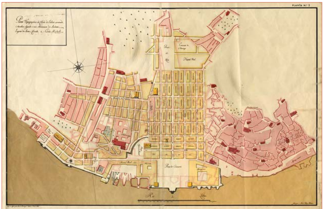
Figura 4 Planta topográfica da cidade de Lisboa arruinada, também segundo o novo alinhamento dos Arquitectos Eugénio dos Santos e Carvalho e Carlos Mardel. In SILVA, Augusto Vieira da – Plantas topográficas de Lisboa , Planta n.º 2. Arquivo Municipal de Lisboa, PT/AMLSB/CMLSB/UROB-PU/11/456/02.