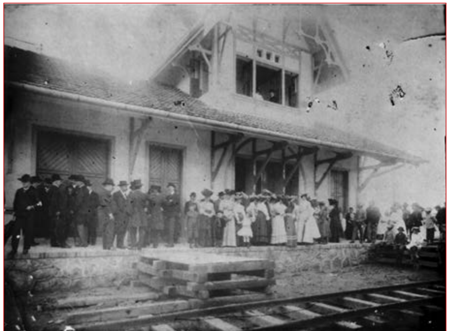
Figura 1 Inauguração da Estação e do Ramal Ferroviário Joinville - São Francisco do Sul, 1906.

Entre 1880 e 1914, a industrialização passa a impactar mais na economia das principais cidades do Estado de Santa Catarina, influenciada tanto pela experiência e conhecimento industrial trazido por muitos imigrantes, quanto pelo “aprimoramento do sistema de transporte”, o crescimento da população urbana e das trocas comerciais 8 . Uma articulação econômica regional foi possível após a abertura da Estrada Dona Francisca (que ligou o Litoral ao Planalto), entre 1855 e 1873, e a criação da ferrovia entre a ilha de São Francisco do Sul e Joinville em 1906, chegando ao Planalto Catarinense em fins da década de 1910 (ver Figura 1). Dessa forma, as pré-condições para o desenvolvimento industrial e econômico da cidade estiveram relacionadas: à produção de alimentos e tecidos; ao beneficiamento da madeira e erva-mate vindas do Planalto; à criação de “casas bancárias e dos mecanismos de crédito”, a partir de 1908; à instalação de companhias produtoras de energia elétrica, entre 1909 e 1915; e aos investimentos em vias de transportes 9 .