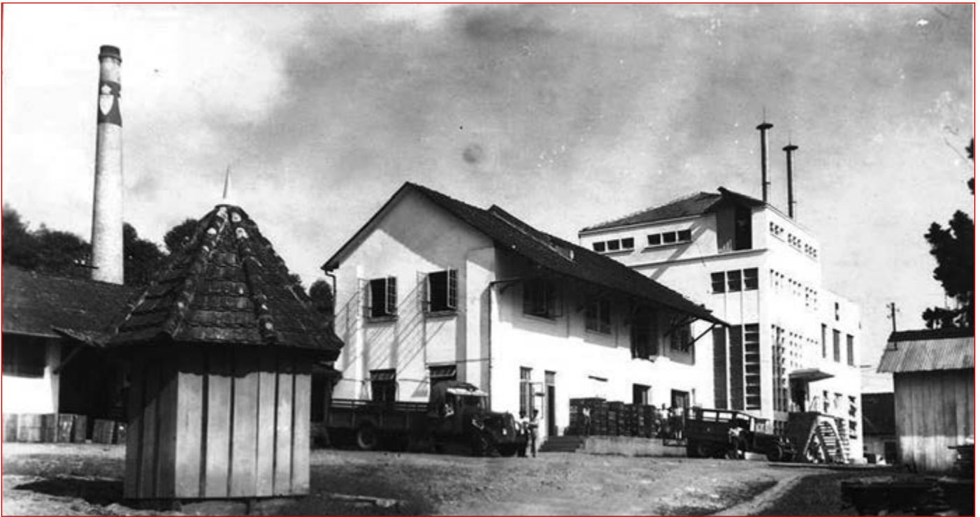
Figura 3 Prédio da cervejaria, 1940, fotografia de Fritz Hofmann. Coleção Particular.

Uma visita dos membros do Rotary Club de Joinville ao interior da cervejaria, em 1936, revelou o funcionamento e as dependências da fábrica e demonstrou, de certa forma, a relação entre a projeção da arquitetura industrial e sua função. Os testemunhos dessa visita revelaram uma construção voltada para a “organização fabril modelo” e a “higiene do local”: