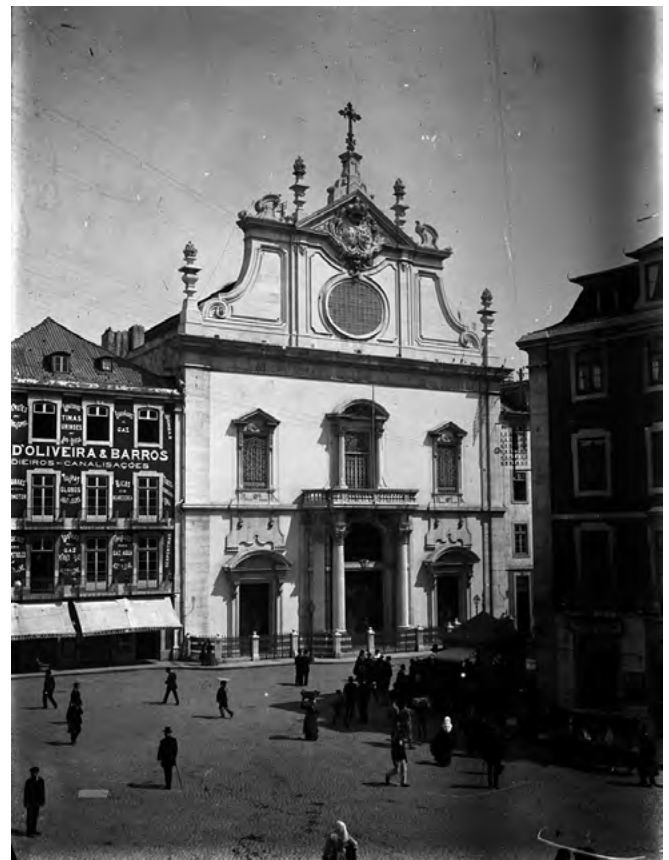
Figura 3 Igreja de São Domingos, fachada principal, negativo de gelatina e prata em vidro, Alberto Carlos Lima, primeira década do século XX. Arquivo Municipal de Lisboa, PT/AMLSB/CMLSB/BAH/PCSP/004/LIM/001099

ao nível dos materiais neles empregues, sendo o registo inferior dominado pela obra de cantaria e o superior pela superfície rebocada. Talvez por isso, na tentativa de harmonizar a frente da igreja, Luís Gonzaga Pereira (ou um oficial de pintura) tenha completado o registo central com duas pilastras (Figura 2).