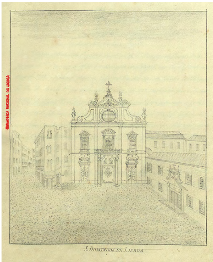
Figura 2 S. Domingos de Lisboa, desenho a grafite, Luís Gonzaga Pereira, 1840. Biblioteca Nacional de Portugal (BNP), Secção de Reservados , cod. 215, f. 94.