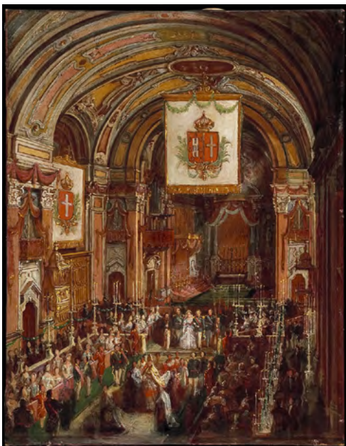
Figura 4 Casamento de D. Luís com D. Maria Pia na igreja de São Domingos, óleo sobre tela, António Manuel da Fonseca (1796-1890), 45,5 x 35,5 cm, c. 1864.