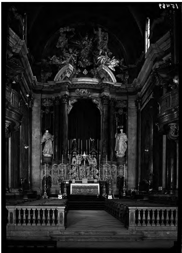
Figura 5 Igreja de São Domingos, negativo de gelatina e prata em acetato de celulosa, 13x18 cm.