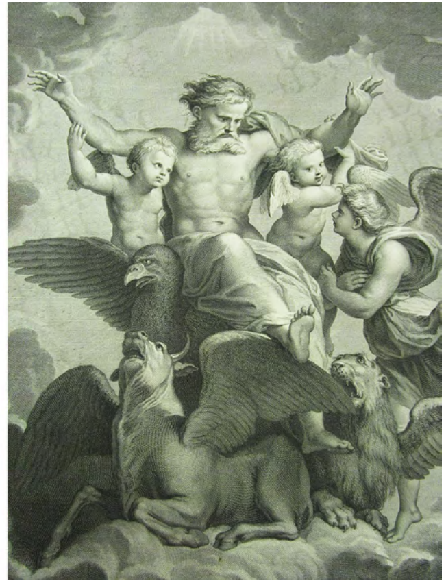
Figuras 9 e 10 Pormenor do deus Júpiter no teto da Sala de Visitas do palácio Porto Covo, de Cyrillo Volkmar Machado (Fotografia: autora), realizado a partir de gravura de Nicolas Larmessin, da pintura de Rafael Sanzio A visão de Ezequiel . In BASAN, François – Recueil d'estampes d'après les plus beaux tableaux et d'après les plus beaux desseins qui sont en France . Paris: Chez Basan, 1763. tome premier.

Isócrates, até à época de Cícero, Horácio, Diodoro da Sicília (...). A reputação de Parrásio acompanhou a cultura antiga desde sempre. E o que é mais importante é que não só as suas obras são descritas, mas a sua arte e técnica são igualmente caracterizadas, assim como em períodos posteriores os seus desenhos foram utilizados como modelos para os artistas 57 .