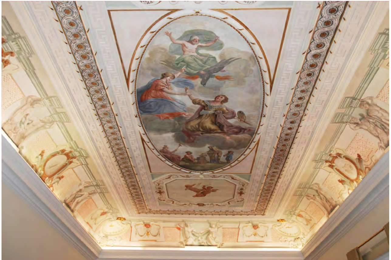
Figura 8 Visualização geral do teto da Sala de Visitas do Palácio Porto Covo, de Cyrillo Volkmar Machado [Em linha]. [Consultado 20.10.2016]. Disponível na internet: http://www.casaruibarbosa.gov.br/acasasenhorial/ .