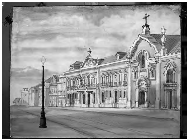
Figura 1 Palácio dos Viscondes de Porto Covo da Bandeira [Em linha]. Fotografia do estúdio de Mário Novais da aguarela do pintor inglês David Ponsonby, datada de 1968. Lisboa: Arquivo Municipal de Lisboa (AML), PT/AMLSB/CMLSBAH/PCSP/004/MNV/001334.

Não existe qualquer tipo de documentação que comprove o nome do arquiteto envolvido, mas, e segundo José Romão, este atribui o risco do palácio a “Joaquim de Oliveira e não Manuel Caetano de Sousa como durante muito tempo se admitiu” 18 . Baseia esta sua pesquisa na verosimilhança arquitetónica entre o frontão da capela do palácio Porto Covo e a igreja Nossa Senhora Jesus (igreja paroquial das Mercês). De fato, numa nota manuscrita de Honorato José Correia de Macedo e Sá, e na entrada referente a Joaquim de Oliveira diz-se assim: “he seo o desenho do frontispício da igreja de Jesus, e todo o convento por ele reformado” 19 . Apesar das notórias semelhanças entre a capela do palácio Porto Covo e a igreja de Nossa Senhora de Jesus, importa salientar que, a título de exemplo, a igreja de Corpus Christi , na rua dos Fanqueiros, apresenta igualmente um frontão contracurvado encimado por fogaréus, decorrente das obras de reconstrução empreendidas pelo arquiteto do Senado, Remígio Francisco de Abreu, após o terramoto de 1755. É por isso difícil definir o arquiteto do palácio Porto Covo sem base documental. Uma coisa é certa: é um palácio com reminiscências fortemente vinculadas a um formulário de cariz barroquizante, muito na senda de Manuel Mateus Vicente, “traindo uma tradição que ainda não tinha morrido completamente” 20 .