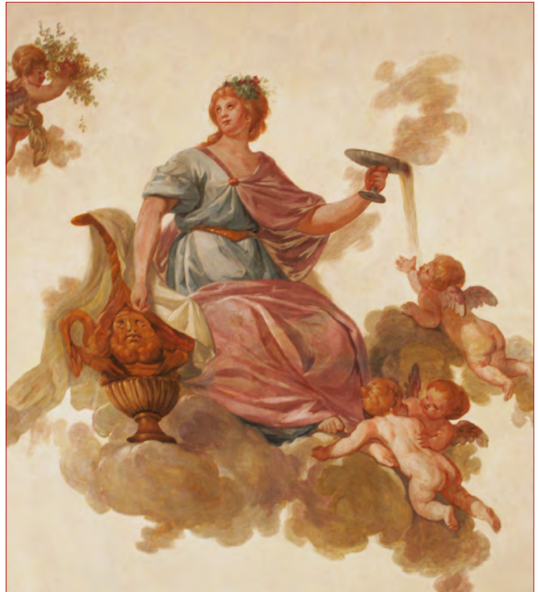
Figura 14 Pormenor da deusa Hebe de Cyrillo Volkmar Machado

pinturas. Nas Reflexões que o artista escreve em 1793, ele encontra-se, de certa forma, já bastante decepcionado com o panorama artístico de finais de Setecentos, referindo que ficou odiado por um conjunto de arquitetos da sua altura 74 . Poderá tudo isto ter influenciado o artista? Talvez nunca se encontre uma resposta plausível, mas é bastante provável que se escondam as mesmas motivações aquando da sua nomeação como pintor de sua “Alteza Real”, para o palácio de Mafra em 1796, pela qual ele tanto lutou.