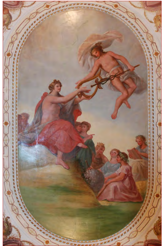
Figura 12 Pormenor dos deuses Apolo, Mercúrio e as musas de Cyrillo Volkmar Machado.

e pequenos; porém todos de auctor conhecido, e celebre; colocados em simetria, e capazes de divertir muito tempo a qualquer entendimento hábil” 66 . Além das pinturas, a sala era composta de “excelentes cadeiras de pau magno com almofadas de damasco verde; e duas bancas, uma defronte da outra com um relógio, e em ambas várias peças preciosas de loiça da India” 67 . No Catálogo dos Objectos de Arte... , citado anteriormente, existem descrições de inúmeras peças que podem corresponder às descrições de Ignácio Menezes – seria uma tarefa