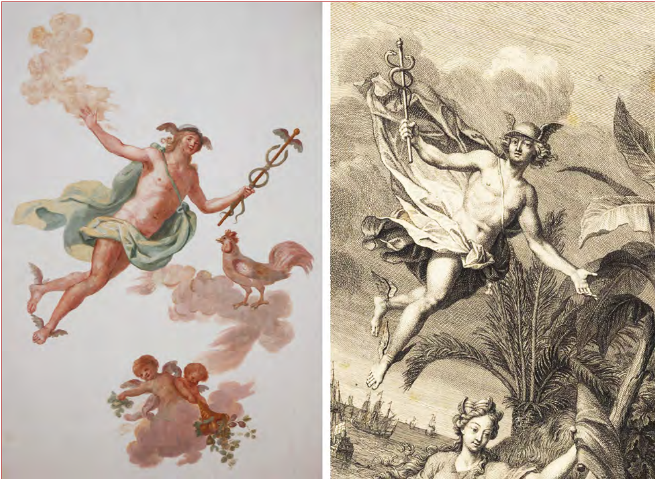
Figuras 6 e 7 Deus Mercúrio na pintura de teto da Sala de Recepção do palácio Porto Covo, realizada a partir de gravura de Bernard Picart. In l'Asie & ses parfums, les trésors de l'Afrique, et de l'une & autre Amerique , 1719.

A escolha iconográfica aponta para ligações com a academia francesa de Roma, muito provavelmente desde os seus tempos de permanência nesta cidade. Esta academia teve um papel decisivo e influente na vida artística em Roma aquando da sua fundação em 1666, promovendo obras que divulgavam o lastro deixado pela cultura greco-romana. A admiração pelos artistas relacionados com a Academia de França em Roma é percebida através do seu Tratado de Simetria : “Poussin, Le Brun, Le Seur, Mignarde, foram mestres que transferirão à França o gosto da Itália e dos antigos” 54 .