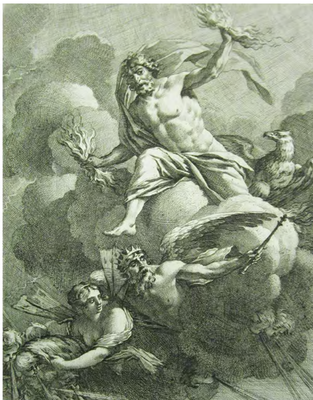
Figuras 4 e 5 Pintura de teto da escadaria do palácio Porto Covo, realizada a partir de gravura de Michel Dorigny de uma pintura de Simon Vouet. In VOUET, Simon; DORIGNY, Michel – Porticus bibliothecae illustrissimi. Segurarii Galliae Cancellarii a Simone Vouët pictore regio depicta , Paris: [s.n.], 1640.

(fundada em 1648) 42 , como Pierre Charles Tremolières. Na generalidade, este método era seguido pelos pintores de História (veja-se o caso de Nicolas Poussin) e pressupunha o conhecimento de inúmeras fontes gravadas, pois era o meio por excelência do método de criação artística em Portugal. O país confrontava-se com a inexistência de um ensino académico estruturante, bem como das obras de pintores consideradas casos de estudo nas melhores academias europeias, pois promoviam a “fecunda imaginação” 43 .