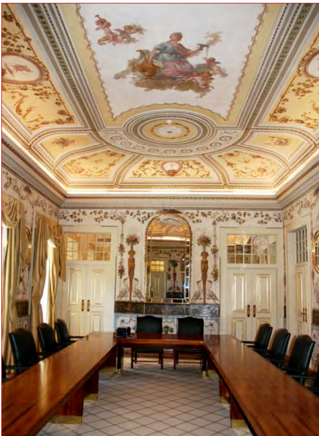
Figura 13 Visualização geral da Sala de Jantar do Palácio Porto Covo [Em linha]. [Consultado 20.10.2016]. Disponível na internet: http://www.casaruibarbosa.gov.br/acasasenhorial/ .