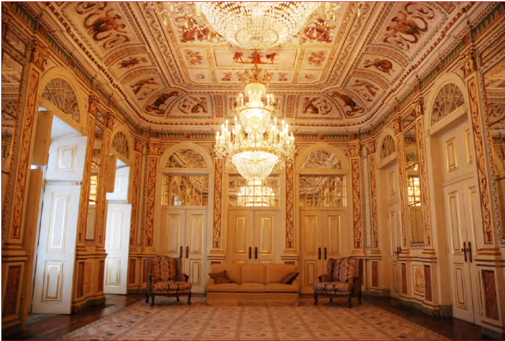
Figura 11 Visualização geral da Sala de Baile do Palácio Porto Covo [Em linha]. [Consultado 20.10.2016]. Disponível na internet: http://www.casaruibarbosa.gov.br/acasasenhorial/ .

doiradas: o tecto é ovado, e d'elle pendem dois lustres de dez luzes cada um, e do mesmo artifício, e riqueza que os outros 65 (ver Figura 11).