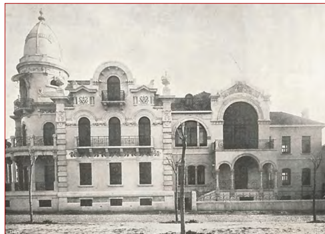
Figura 12 Edifício Amélia Augusta Pereira Leite. A Architectura Portuguesa Ano III N.º 3 (março de 1910), Intercalar VI.

AML, PT/AMLSB/CMLSBAH/PCSP/004/PAG/000664.