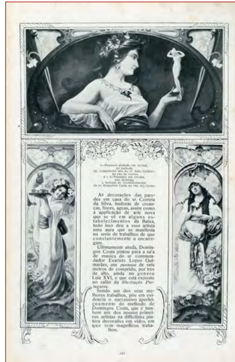
Figura 15 Painel para a fachada do Armazém de Novidades João Cardozo , em cima. Alegoria ao Chá e ao Café , em baixo, e que figuraram as duas na Exposição Nacional no Rio de Janeiro em 1908. Ilustração Portuguesa . 2.ª Série N.º 264 (13 de março de 1911), p. 352.