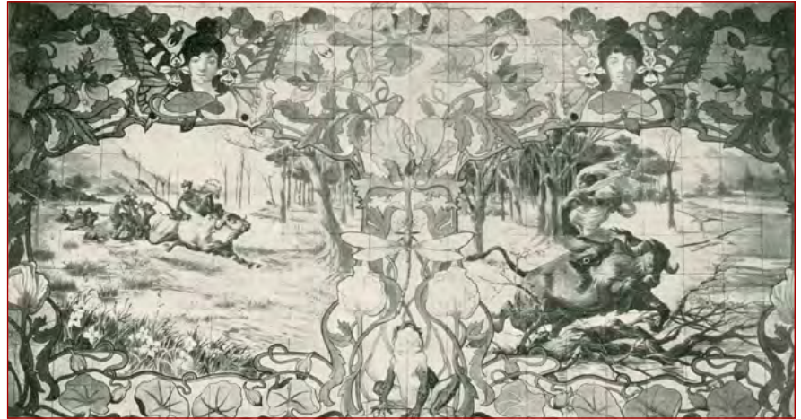
Figura 9 Painel do projeto Phantasia sobre motivos mythologicos exposto no atelier do pintor Jorge Colaço. Ilustração Portuguesa 2.ª Série N.º 227 (27 de junho de 1910), p. 823. Coleção do autor.

o globo terrestre e na mão segura um candeeiro elétrico. Os traços enfatizam o esvoaçar dos tecidos e do corpo feminino ao gosto Arte Nova.