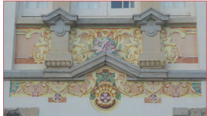
Figura 8 Painéis no grande janelão da fachada nascente do Chalet Malvina , fotografia do autor, 18 de setembro de 2011.

após o seu casamento, em 1906, na rua Tomás Ribeiro. Participou em várias exposições e parece ter enveredado, a partir de 1906, pela azulejaria. Efetivamente, na sua obra, temos vindo a constatar uma influência da Arte Nova francófona e o gosto pela época da Renascença (em voga no início do século XX), nomeadamente na azulejaria produzida pelas já referidas manufaturas Hautin-Boulenger & Co e Maison Helman . Explorou o constraste entre cores, o emprego de tons lustrosos e outras características muito peculiares. Não parece ter trabalhado diretamente com uma única manufatura mas cozido em várias oficinas, as suas obras em azulejo 64 .