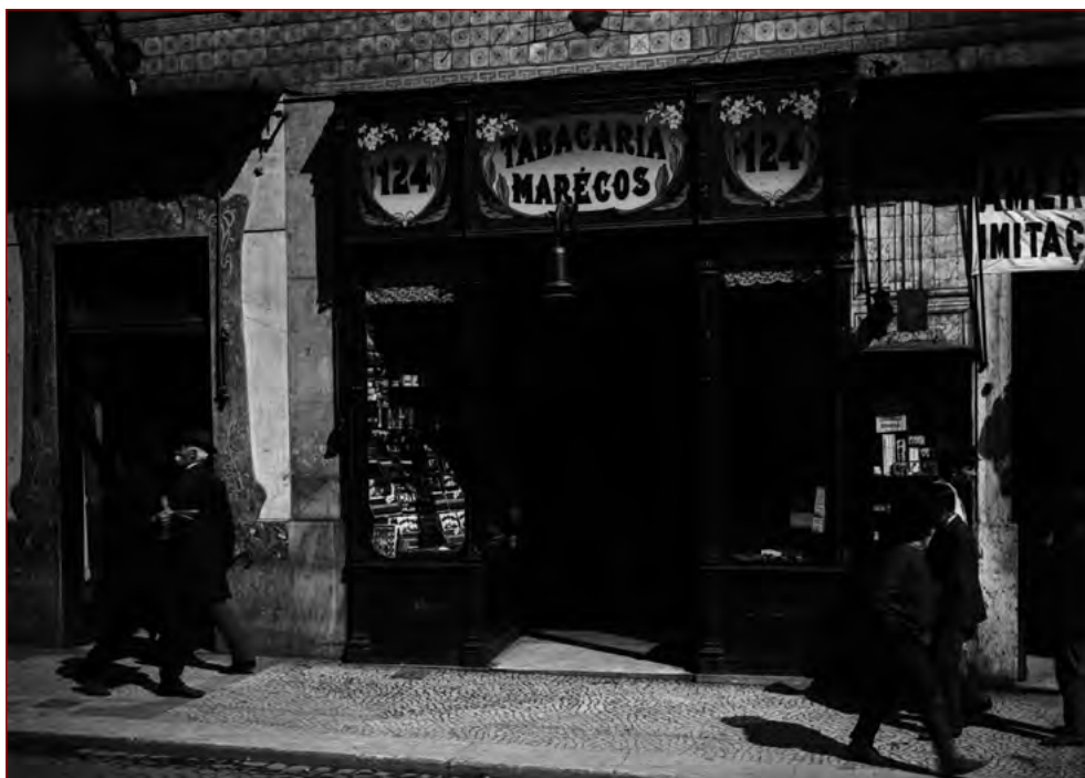
Figura 3 Café/Restaurante/Cervejaria Imperial, lado esquerdo, e ao centro a Tabacaria Marécós, remodelada em 1912, negativo de gelatina e prata em vidro, 9x12 cm