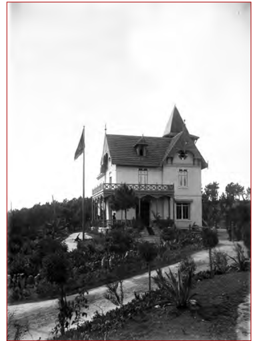
Figura 1 Chalet Montrose por ocasião da estadia da Rainha Dona Maria Pia, negativo de gelatina e prata em vidro, 18x24 cm, autor não identificado.