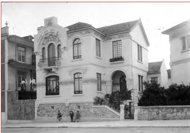
Figura 11 Casa António Pinto da Fonseca Mota, rua Pinheiro Chagas, negativo de gelatina e prata em vidro, 13x18 cm, Paulo Guedes, [19--].

AML, PT/AMLSB/CMLSBAH/PCSP/004/PAG/000664.