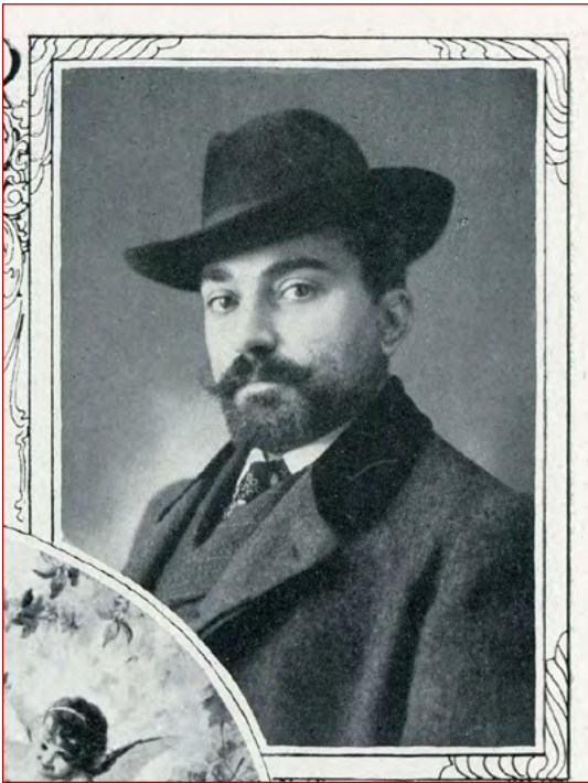
Figura 14 O pintor Domingos Maria da Costa. Ilustração Portuguesa 2.ª Série N.º 264 (13 de março de 1911), p.350.