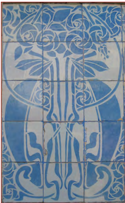
Figura 5 Motivo padronizado no vestíbulo de entrada de uma das Casas Alvaro Machado no Estoril, em azul. A originalidade na interpretação da Arte Nova, deste conjunto, foi adaptada ao gosto português pelo uso do azul sobre fundo branco no azulejo. Fotografia do autor, 8 de janeiro de 2010.

trabalho do arquiteto escocês Charles Rennie Mackintosh, ao representar as rosas. Esta representação também foi seguida pela manufatura alemã Grohner Wandplattenfabrik e pela Villeroy & Boch 54 . Em Bruxelas existe este tipo de rosas em esgrafito, nomeadamente: num edifício na rue des Eburons , datado de 1898, e na fachada principal da casa do arquiteto Paul Cauchie, construída em 1905 55 .