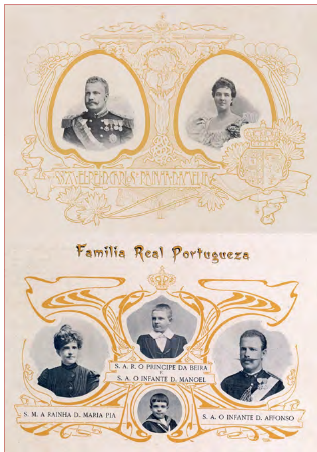
Figura 2 Montagem das fotografias emolduradas com a Família Real Portuguesa, o grafismo é da autoria de Alonso. Album Açoriano Oliveira & Baptista (1903).

especificamente colocado segundo o projeto do mesmo arquiteto 26 . Os azulejos têm sido atribuídos à já mencionada manufatura das Devesas 27 .