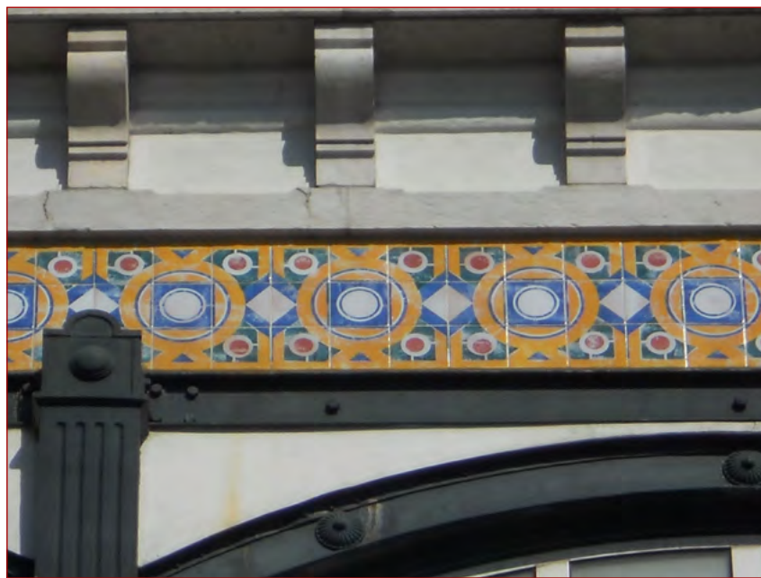
Figura 7 Frisos azulejares na fachada poente do edifício Armazéns Casa do Povo d'Alcântara . Fotografia do autor, 3 de maio de 2011.

A maestria de José António Jorge Pinto no uso de cores, dos seus tons e técnicas comprova o engenho que tinha na arte da cerâmica. A capacidade notável em reinterpretar as diversas influências estrangeiras foi expressa num variado conjunto de azulejaria, o que o torna num dos pintores mais profícuos e originais deste período. Parte do seu trabalho encontra-se em edifícios que foram contemplados pelo Prémio Valmor.