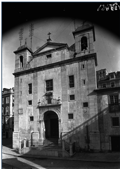
Figura 7 Igreja de São Cristóvão no início do século XX. O atual edifício corresponde a uma campanha de finais do século XVII e inícios do século XVIII, porém, nas suas fundações estará a medieval Igreja de Santa Maria do Alcamim, que funcionou como Sé Catedral dos cristãos moçárabes sob domínio islâmico nos séculos XI e XII. Negativo de gelatina e prata em vidro, Machado & Souza, 13 x 18 cm, 26/11/1901. AML, FAN001854.

Porém, o Bairro de São Cristóvão sofreu inúmeras alterações urbanas que desvirtuaram o seu perfil medieval. O adro da Igreja de Santa Maria de Alcamim foi sendo cerceado sucessivamente, tendo perdido o seu aspeto de praça com uma igreja no centro. Para isto contribuíram diversos fatores: a própria igreja que recebeu sucessivas campanhas de obras no século XVII e XVIII (fig. 7). Em 1735, a Câmara Municipal de Lisboa autorizou a construção