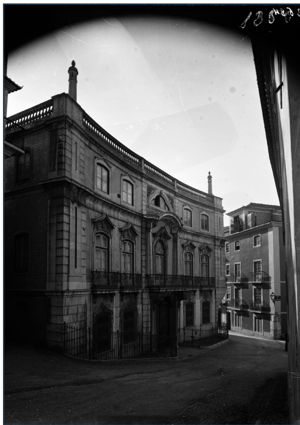
Figura 8 Palácio Vagos nos inícios do século XX, local dos paços do conde de Barcelos, do bispo de Coimbra, dos Mirandas e do duque de Bragança (em simultâneo) e por fim do regedor da Casa da Suplicação. O atual edifício corresponde a um palácio do final do século XVIII inacabado e com fortes alterações do século XIX e XX, não restando nada do seu passado medieval. Negativo de gelatina e prata em vidro, Machado & Souza, 13 x 18 cm, 26/11/1901. AML, FAN002684.

que o habitava em 1450 37 , que, por sua vez, terá cedido uma parte ao duque de Bragança que aí habitou em 1450, 1473 e 1474 38 . A coabitação era feita de forma atípica: os Mirandas habitavam o piso térreo e os duques o piso superior, tendo ambos vendido a sua parte a Aires da Silva, regedor da Casa da Suplicação, que reunificou o velho paço dionisino em 1512 39 . Neste paço residiu também, em 1451, a infanta D. Leonor, filha do rei D. Duarte, depois do seu casamento por procuração com o imperador Frederico III. Este edifício permaneceu nos Silvas, senhores de Vagos, sendo conhecido hoje como Palácio Vagos (fig. 8). Já nada se preserva desta realidade medieval, muito devido às obras de vulto realizadas no século XVIII e XX e do facto do local ser utilizado como residência de famílias pobres em meados do século XIX 40 .