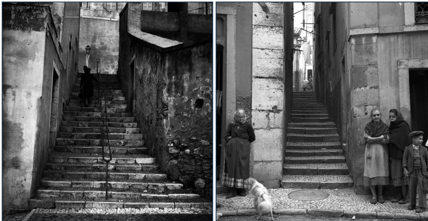
Figuras 5 e 6 Dois exemplos de arruamentos transversais no Bairro de São Cristóvão / Arrabalde do Alcamim, constituídos por escadinhas estreitas que venciam a inclinação acentuada do terreno. À esquerda, Escadinhas da Achada. À direita, Escadinhas do Beco do Jasmim. Negativos de gelatina e prata em nitrato de celulose, POZAL, Fernando Martinez, 6 x 6 cm, 1945. AML, POZ000255 e POZ000275.

A grande diferença de cotas que existe entre estas ruas não permitia a existência de travessas, pelo que o cruzamento era feito por escadinhas (figs. 5 e 6). O bairro teria assim, pela topografia e pela necessidade de auto-preservação, uma imagem de várias fiadas de casas dispostas horizontalmente em vários níveis, como em prateleiras, ou “a modo de bairros recortados nas rochas”, facto que ainda hoje visível.