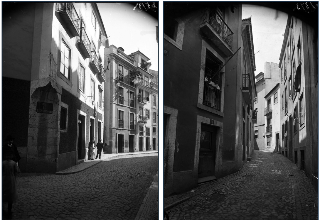
Figuras 3 e 4 O Alcamim na atualidade.

A partir daqui, as ruas abriam em leque, em várias vias paralelas ao Alcamim (fig. 3 e 4).