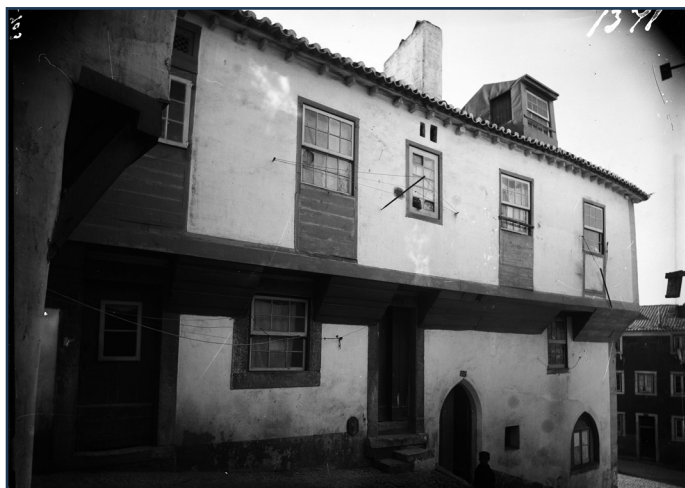
Figura 9 Casa de arquitetura medieval na Rua da Achada. Cada porta para a rua correspondia a um lote habitacional que em época posterior era unificado numa casa maior. Negativo de gelatina e prata em vidro, Machado & Souza, 13 x 18 cm, 29/11/1901. AML, FAN002703.

Ao longo destes 250 anos vemos também uma evolução ao nível do valor do imobiliário. No século XIV as casas tinham um valor suficientemente alto e bastante procura para justificarem um loteamento no ano de 1362. Porém, em 1377, vemos um grande número de habitações arruinadas e outras a serem entregues, gratuitamente, a criados régios retirados do serviço. Em meados do século XV, o local começa a ser alvo de procura da pequena nobreza que emergiu com a ascensão da Casa de Avis. A escolha do local para residência do bispo de Coimbra e do duque de Bragança, figuras influentes no reinado de D. João I, poderá justificar a escolha do local pelos pequenos funcionários régios. O preço dos aforamentos, porém, sobe em flecha afastando os pequenos artesãos que haviam caracterizado o local nos anos anteriores. A nobreza utiliza o seu poder económico e influência junto