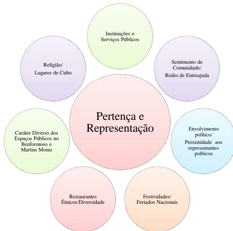
Figura 2. Mapeamento de perceções interculturais sobre fatores de impacto no sentimento de pertença e de representação

momentos históricos, não obstante o conhecimento dos legados culturais de Lisboa não serem temas presentes na comunicação com a família na origem. Nesse domínio, o da partilha com a origem, a afabilidade da população autóctone e o clima são os elementos mais referidos.