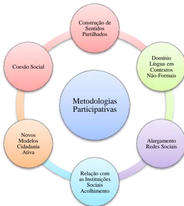
Figura 1. Ciclo de relações entre as dimensões acionadas no processo participativo com populações imigrantes