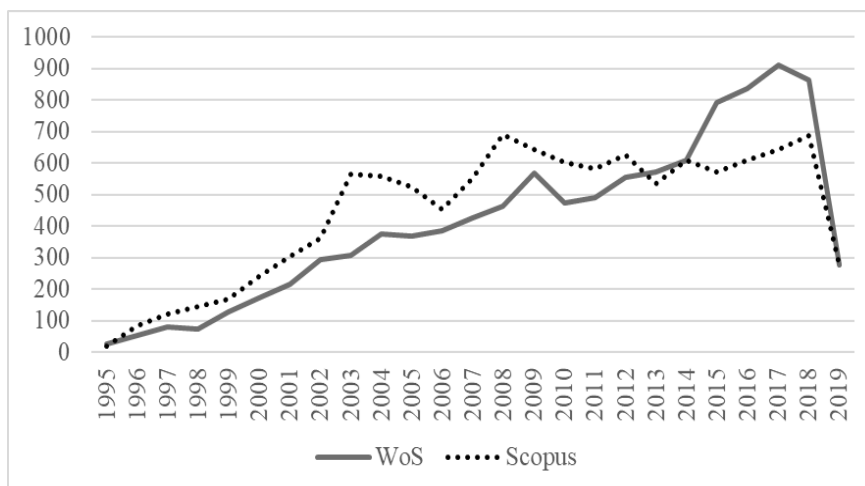
Figura 1. Evolución del número de publicaciones (1995-2019) de Internet Law

Las principales áreas de investigación que han aportado contribuciones relevantes de aspectos legales en Internet son Ciencias de la computación, Legislación gubernamental o Economía y empresa, aunque también son destacables otras áreas como las Ingenierías, Telecomunicaciones, Ciencias de la información o las Matemáticas. Por lo que el uso de aspectos legales por parte de investigadores de otras áreas de investigación, diferentes a las del Derecho, queda patente a la vista de los resultados. Especialmente, en aquellas áreas más relacionadas con el desarrollo de Internet y sus servicios asociados, tal y como se refleja en la tabla 1.