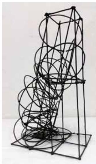
Figura 1 · José Zugasti. Figura subiendo la escalera, 1994