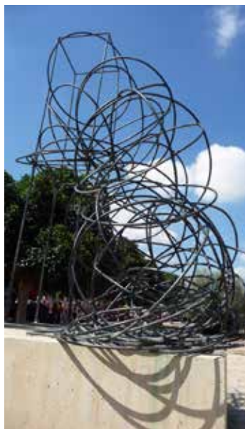
Figura 6 · José Zugasti. "A la deriva" Paseo de Abandoibarra. Bilbao, 2002. 42 barras de acero, hormigón, arena. (590 x 500 x 800 cms.). Producción: Alfa — Arte . (Calderería Marferdi).