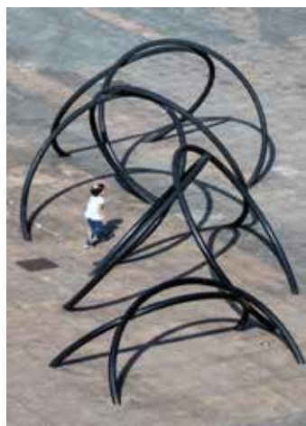
Figura 8 · José Zugasti. "Flo Nua" . Instalado en San Fuster (Palma de Mallorca), 2005. Hierro. 4 módulos de 2 m. Que se engarzan entre sí en un aro situado en el suelo.