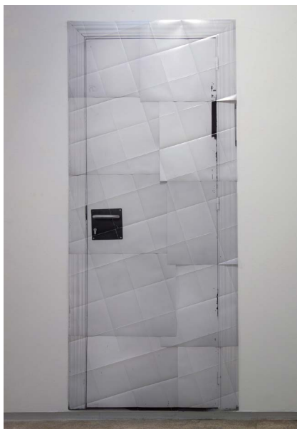
Figura 3 · Marco Moreira, Sin título (lápices y dibujo sobre pared #2, dimensiones variables), 2015.