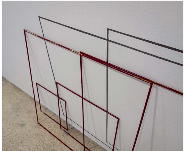
Figura 1 - Marco Moreira, Sin título (6 lápices de grafito, 16 x 16 x 16 cm), 2014.