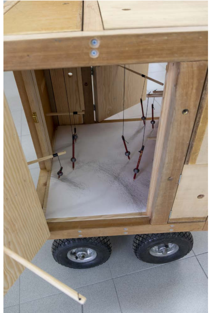
Figura 6 · Marco Moreira, Sin título (madera, bolas de grafito, papel, 71 x 50 x 5,5 cm), 2012.