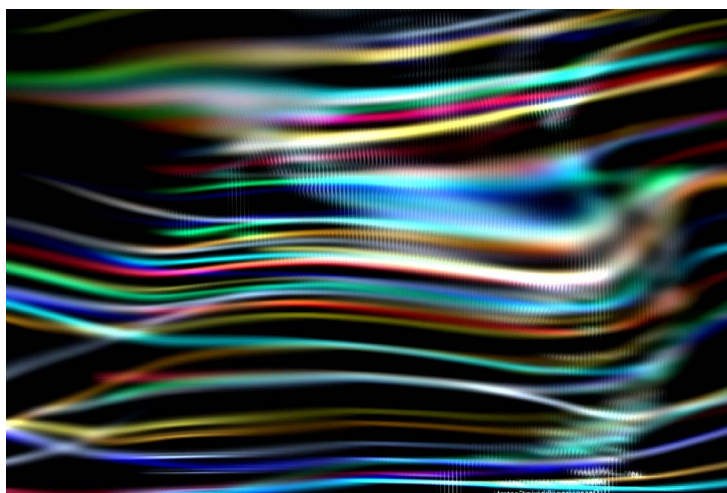
Figura 3 · Massimo Cova. Electronic Failed. S/T (4:3) (2014). Impresión digital, 12 x 16 cm.