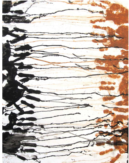
Figura 1 · Massimo Cova. Va pensiero sull'ali dorate (2009). Tinta china y lápiz s/papel. 35 x 50 cm.