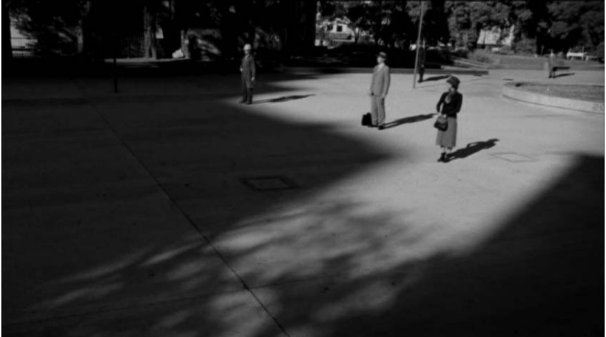
Figura 2 · Juan Pablo Zaramella, Still de Luminaris (2011), a luz que impele os personagens a deslizarem pela rua, a caminho do trabalho.