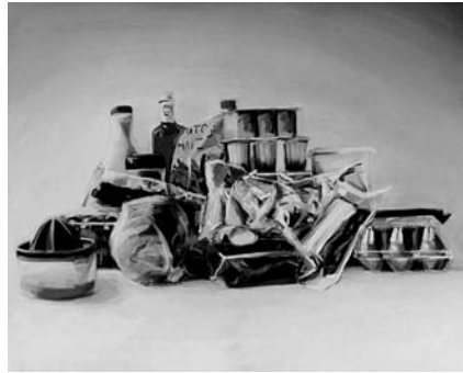
Figura 1 · Isla , 2011. Óleo sobre lienzo, 35x27 cm. Autor: C. Tabares. Fuente: Cristóbal Tabares.