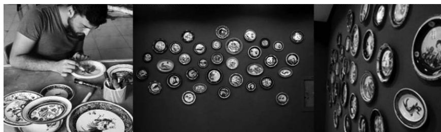
Figura 5 · Cristóbal Tabares. Plastic porcelain , 2014. Fuente: Cristóbal Tabares, Autor: Galería Metro.