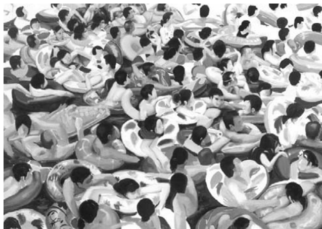
Figura 9 · Cristóbal Tabares Orden . 2014 Óleo sobre lienzo, 130x160 cm Fuente: Cristóbal Tabares. Autor: Daida Suarez.