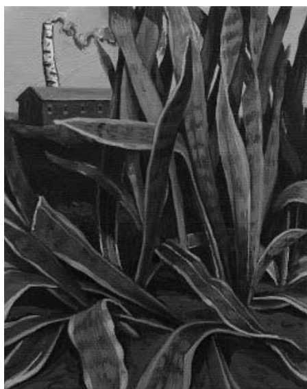
Figura 4 · Tiago Baptista (2011), Sem Título . Acrílico sobre tela, 190x230 cm. Fonte: Tiago Baptista Figura 5 · Tiago Baptista (2013), Untitled . Óleo sobre tela, 30x24 cm. Fonte: Tiago Baptista.