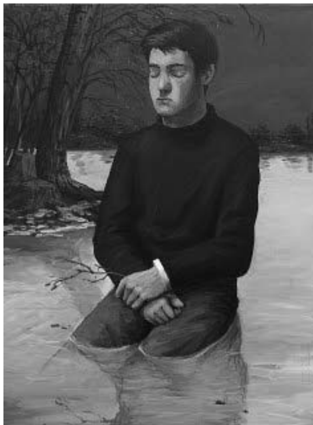
Figura 3 - Tiago Baptista (2013), Untitled . Óleo sobre tela, 80x60 cm. Fonte: Tiago Baptista.