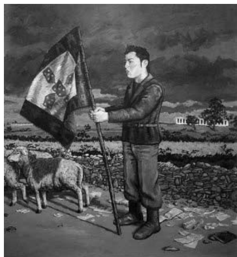
Figura 1 · Tiago Baptista (2010), O Narciso das Fossas . Acrílico sobre papel, 190x150 cm.