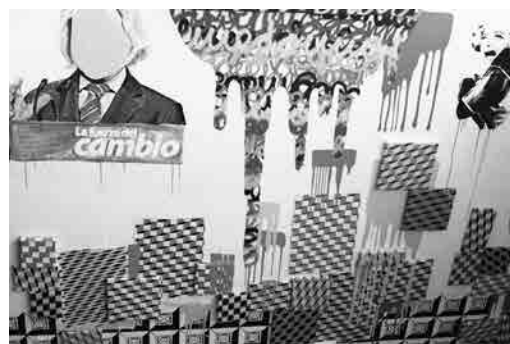
Figura 1 · Marcos Covelo, Cambio , 2011. Exposición "Trabajo Fin de Máster". Fundación RAC, Pontevedra (España).