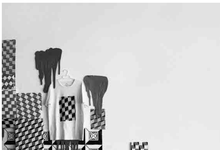
Figura 4 · Marcos Covelo, Cambio , 2011. Exposición "Traballo Fin de Máster". Fundación RAC, Pontevedra (España).