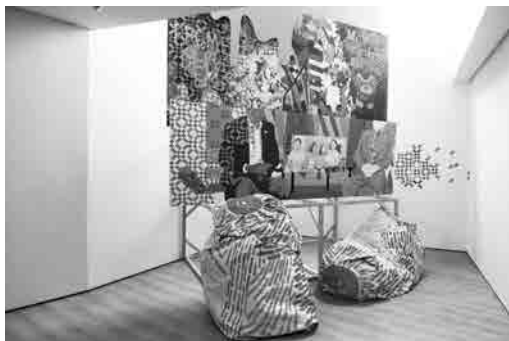
Figura 8 · Marcos Covelo, The answers are blowin' in the wind , 2011. Exposición individual en la Fundación RAC, Pontevedra (España).

subrayar nuevas técnicas pictóricas no convencionales, tales como, el uso de cinta aislante de colores o el hecho de construir diferentes formas con recortes de vinilo sobre pared. La instalación, en continuo proceso de creación, era un boceto tridimensional en el que primó la espontaneidad. El objetivo fundamental recaía en cuestionar los parámetros que siempre han definido el proceso y creación de una obra pictórica tradicional. Por este mismo motivo, pensé que el título de este proyecto podría sintetizar adecuadamente el contenido de este artículo.