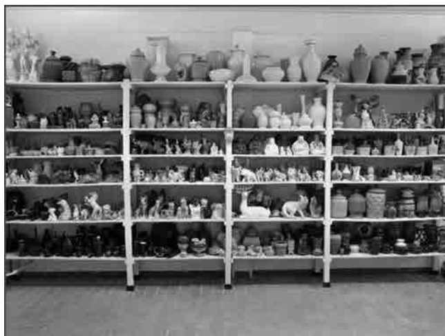
Figura 1 · Barrão, Terrina Noé , 2013. Faiença.

37x33x32,8cm. Tiragem de 250 exemplares.