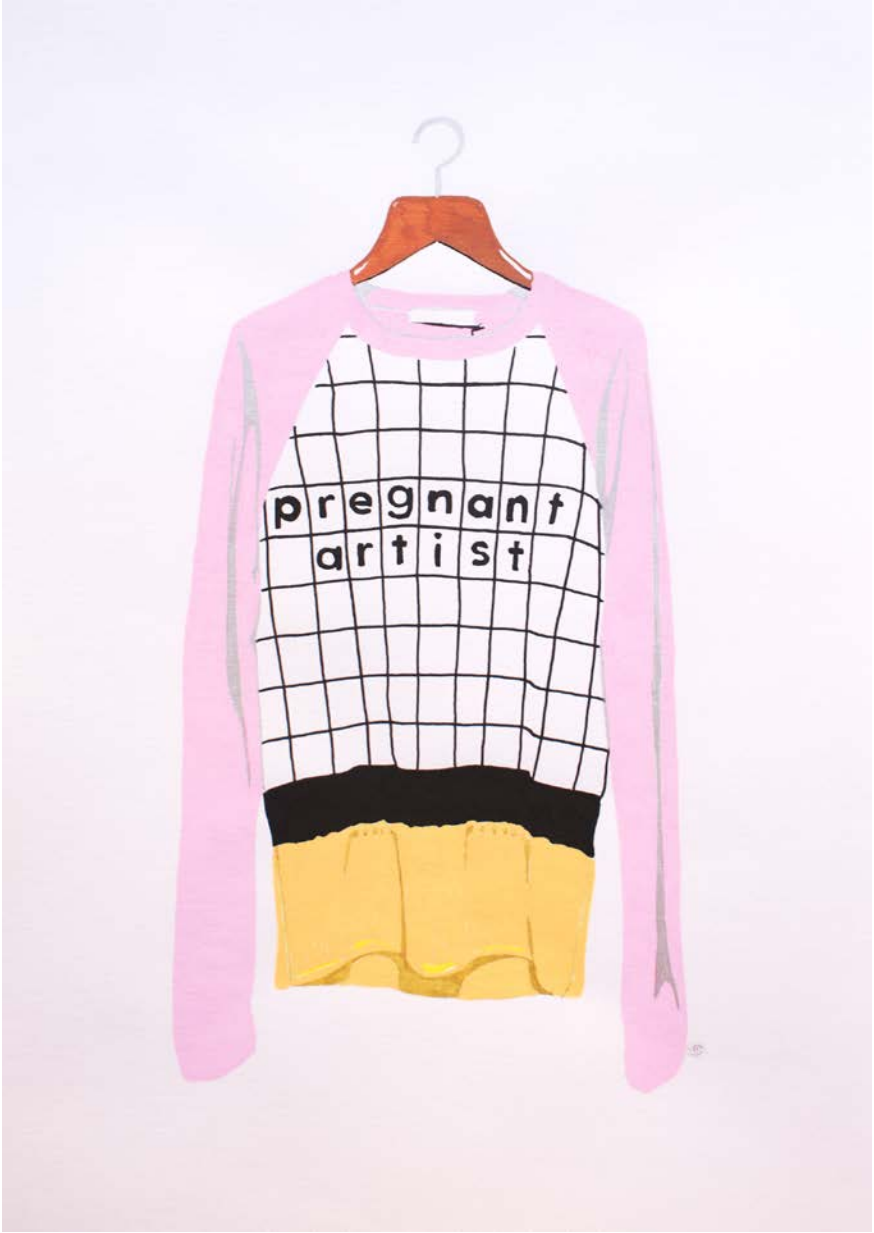
Figura 8 - Bea Sánchez, Pregnant artist . Posca sobre papel. 29,7 x 21 cm. 2015.