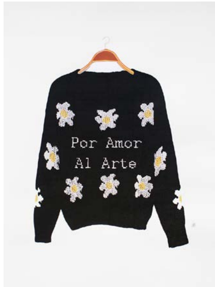
Figura 2 · Bea Sánchez, Fallo del jurado . Posca sobre papel. 29,7 × 21 cm. 2015. Fuente: Bea Sánchez.