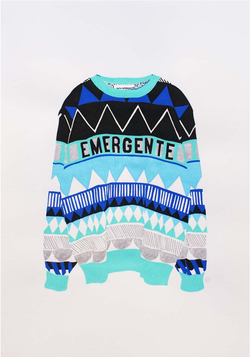
Figura 9 · Bea Sánchez, Emergente . Posca sobre papel. 29,7 × 21 cm. 2015.