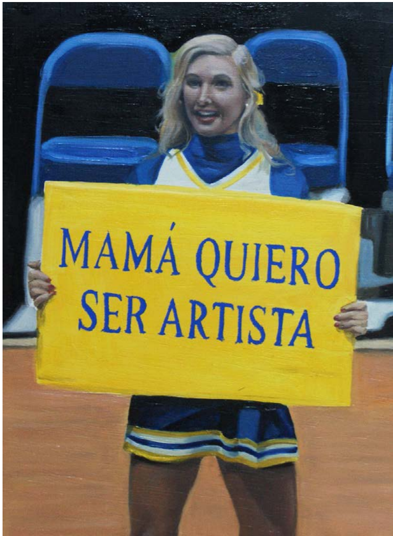
Figura 1 - Beá Sánchez, Mamá, quiero ser artista . Óleo sobre tabla. 24 x 18 cm. 2015. Fuente: Beá Sánchez.