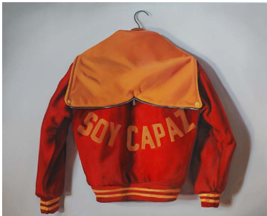
Figura 9 · Bea Sánchez, Soy capaz . Óleo sobre lienzo. 73 × 92 cm. 2015.