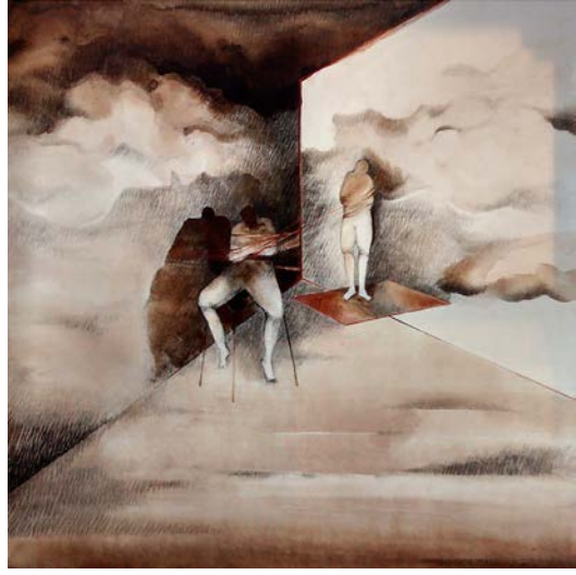
Figura 4 · Elda Di Maglio. Fuente: Libro "Shinki-Di Malio", 2017, ICPNA, Lima, Perú.