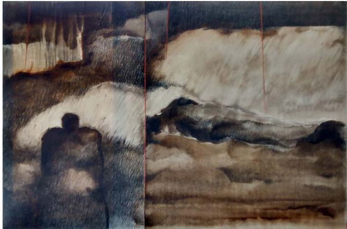
Figura 3 · Elda Di Maglio.