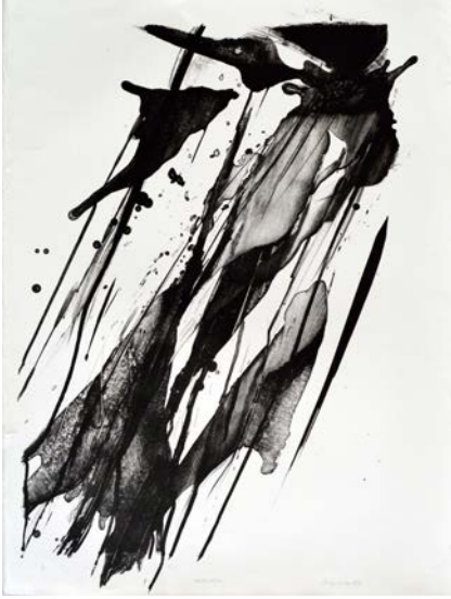
Figura 4 · Nilza Haertel. Autumn composition , impressão de entalhe e em relevo, 48 x 33 cm, 1983. PE de Autumn composition, impressão de entalhe.