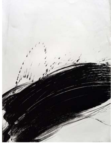
Figura 5 · Nilza Haertel. Water Wings , litografia, 76,5 x 57 cm, 1984.