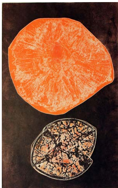
Figura 2 · Nilza Haertel. Soneto , impressão em relevo, 46 x 31 cm, 1979. PE de Contraponto , impressão em relevo, 48 x 33 cm, 1979. Duas sementes , impressão de entalhe e em relevo, 44 x 31,5, 1980.