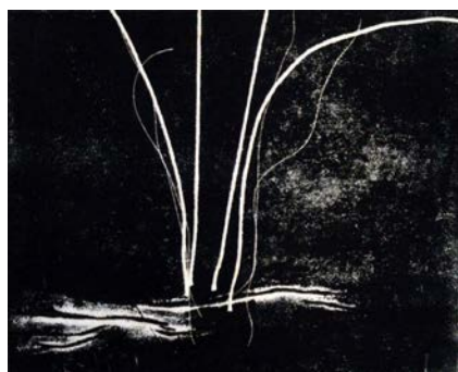
Figura 1 - Nilza Haertel. Matriz feita em colagravura e impressões em relevo, s/t, 22,5 x 28 cm, s/d.