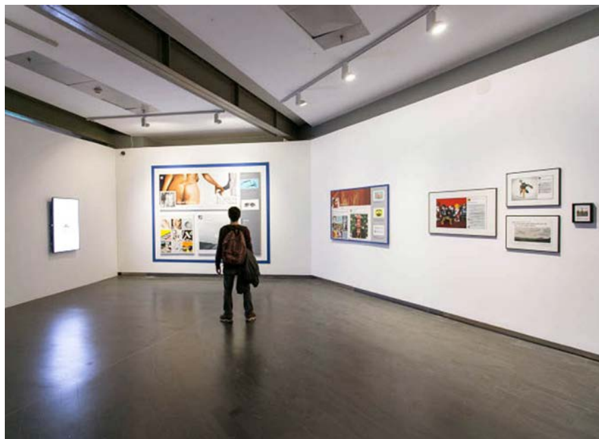
Figura 5 · 24/7. Conectados , 2017. Centro Centro Cibeles, Madrid. Vista de la exposición.