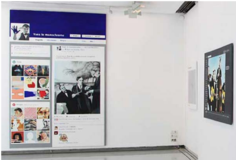
Figura 3 · Jean Auguste Dominique Ingres, 2016. Acrílico sobre papel. 105 x 153 cm.