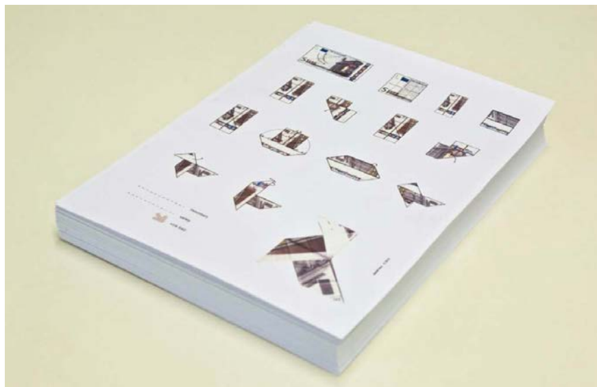
Figura 3 · Daniel Silvo, Sin título, 2010. Taco de panfletos con las instrucciones de plegado de la pajarita origami realizada con billete de 5 euros.