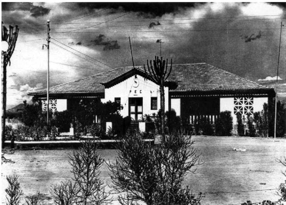
Figura 3 – “Casa do diretor”, Posto Experimental do Caracul, c. 1960.

como aqueles praticados pela mulher de Santos Pereira e descritos por Freyre (Stoler 2002). Afinal, já Malinowski chamava a atenção na década de 1940 para o facto de “a comunidade de colonos brancos não ser de forma nenhuma uma réplica direta da comunidade da metrópole” (Malinowski 1966 [1945]). A mimese da vida portuguesa – materializada tanto na formalização excessiva dos atos quotidianos como na arquitetura “casa portuguesa” da residência do diretor com a sua varanda e latada –, mais do que transplantar Portugal para África, constitui um elemento de construção da “comunidade inventada” do colono branco (Anderson 1983). Esta “casa portuguesa ultramarina” (Milheiro 2012), na expressão dos técnicos do Gabinete de Urbanização Colonial responsáveis pelos projetos arquitetónicos de casas para colonos e para funcionários da administração colonial, era, como bem sublinhou Ana Vaz Milheiro, mais portuguesa que a própria “casa portuguesa” na metrópole (Milheiro 2012). O posto juntava assim à mimese por defeito do “bairro indígena” a mimese por excesso da metrópole, a qual era destinada, como afirmava o próprio Santos Pereira, a “reproduzir criadores de caraculos” (Pereira 1959). O posto não era mais, pois, do que o primeiro núcleo de um projeto de colonização que ocuparia um território com extensão semelhante ao do Portugal metropolitano e que estaria destinado a ser mais português que Portugal.