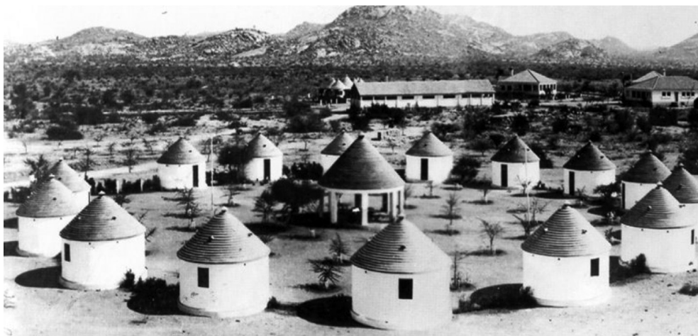
Figura 1 – “Bairro indígena” do Posto Experimental do Caracul, c. 1960.

Nas pastagens, milhares de cabeças de gado já adaptadas ao deserto. Os cruzamentos acabaram pela revelação de um tipo como que ecológico de carneiro. Carneiro do deserto” (Freyre 1980 [1953]: 374). Cabe aqui citar ainda o final do livro, no qual Gilberto Freyre refere a sua entrega ao Presidente do Brasil da oferta do Presidente da República Portuguesa de um cofre com uma rara e velha edição de Os Lusíadas , de “tal modo composto com diamantes de Angola, marfim de Moçambique, ouro da Guiné, prata de Portugal, pérolas do Oriente português, madeira de Cabo Verde – que todo ele irradia Portugal, o Ultramar português, o carinho pan-lusitano pelo Brasil” (Freyre 1980 [1953]: 444). O dito cofre ia forrado a nada mais, nada menos que pele de caracul de Angola. 13 Vale, pois, a pena explorar esta inesperada referência de Freyre ao caracul, analisando-a como materialização das supostas “constantes portuguesas de caráter e ação” por ele avançadas. Importa, por outras palavras, investigar a natureza luso-tropical do caracul.