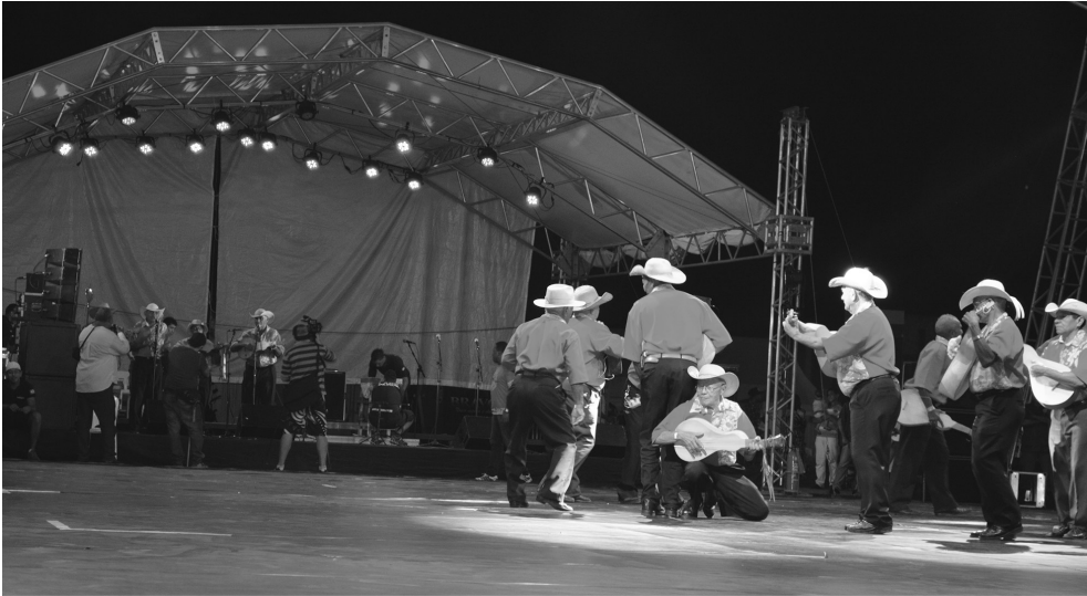
Figura 6 – Festival de Cururu e Siriri, Cuiabá (MT). Foto: Patricia Osorio, 2014.

tro do palco. Acopladas a microfones, as violas de cocho são manejadas fora do palco e do campo de visão do público. A música não é “vista” pelo público, uma vez que os cururueiros estão posicionados em um espaço periférico e pouco iluminado da arena. Cria-se no espetáculo unidades separadas entre a execução musical e a dança. Os cururueiros que tocam não dançam, os que dançam não tocam. O festival separa a dança da música. E, entre a dança e a música, a primeira assume o protagonismo no evento festivo (figura 6).