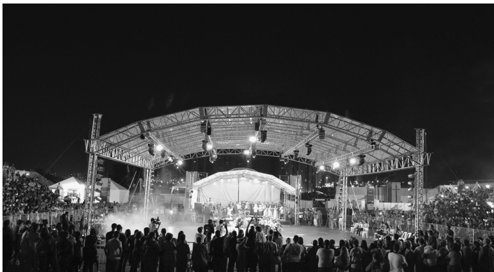
Figura 4 – Festival de Cururu e Siriri, Cuiabá (MT).