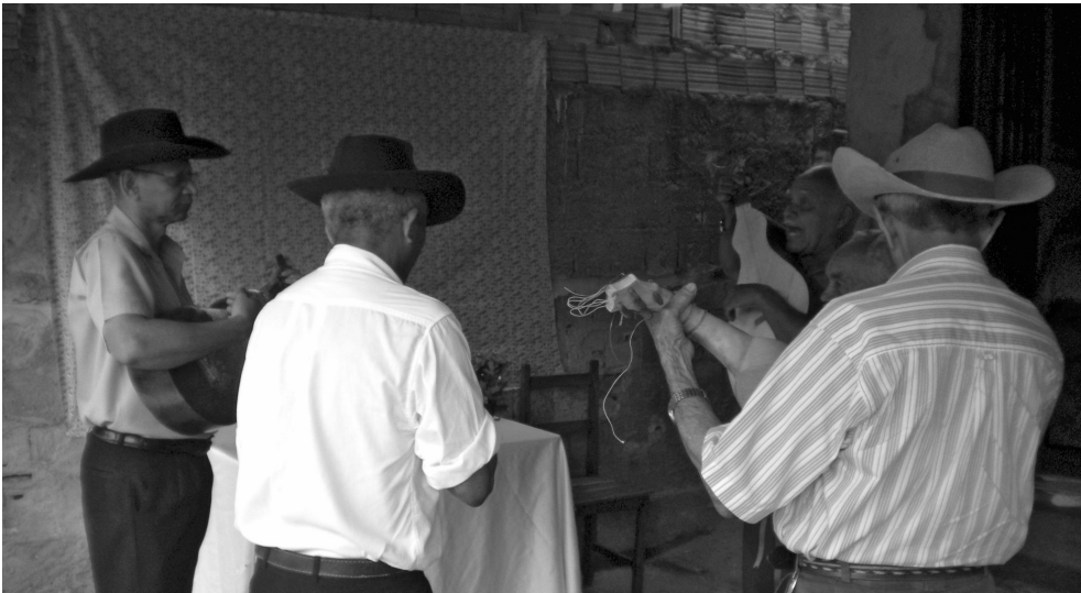
Figura 2 – Roda de cururu em uma festa de santo, Cuiabá (MT).

Atualmente os cenários de exibição ampliam-se para além das festas de santo. Um caso exemplar é o surgimento em Cuiabá do Festival de Cururu e Siriri no início dos anos 2000 e que mobiliza grupos de diferentes cidades de Mato Grosso. O público é composto por turistas de passagem pela região, mas