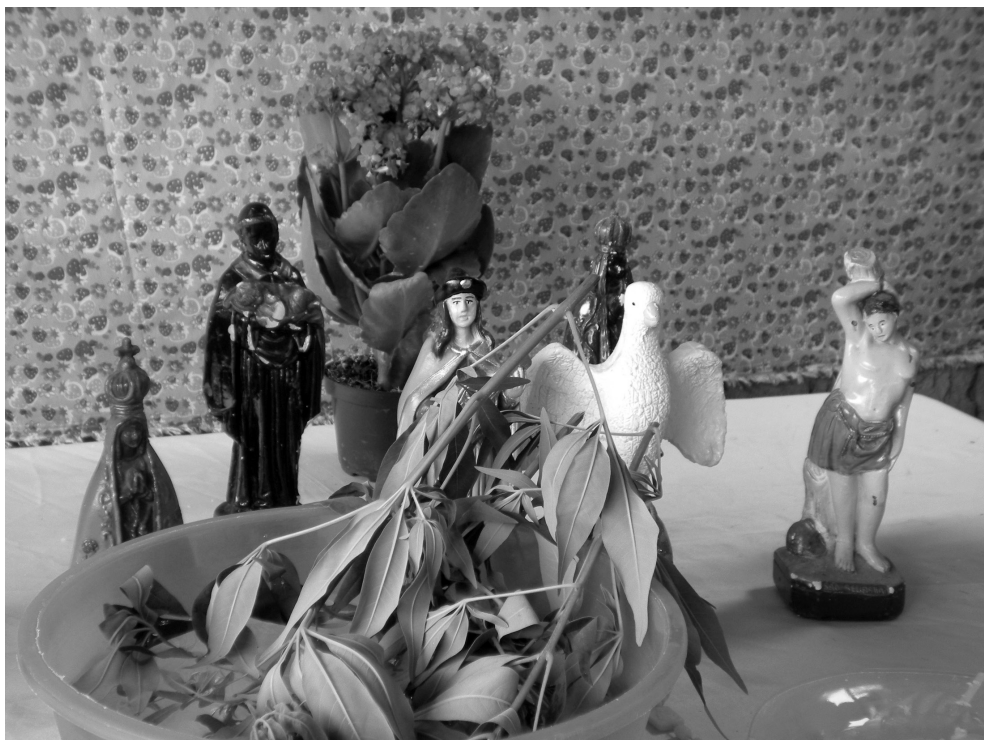
Figura 3 – Detalhe do altar, Cuiabá (MT). Foto: Patricia Osorio, 2012.