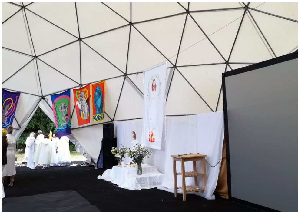
Figura 3 – Conferência da Deusa Portugal, Maio de 2019, tenda e altar, Sintra, Portugal.

“... serão três dias de imersão no outro lado do véu, em profunda comunhão com a nossa herança celta passada, recuperando as tradições quase perdidas de celebrarmos a Senhora à nossa maneira, mantendo o espaço