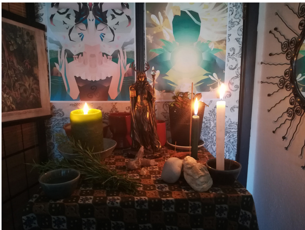
Figura 4 – Altar criado para acompanhar a Glastonbury Goddess Conference online , 2020.

“Temos que criar uma conexão que é restauradora, não só para a natureza, mas para nós humanos, e para o nosso lugar dentro da Sua [Terra/Deusa] natureza. [...] Ela diz-nos que nunca estamos acima ou desconectados, estamos profundamente enraizados Nela [...]. Ela lembra-nos que nunca temos ‘propriedade sobre’, mas somos sim parte da ‘pertença a’. A Sua forma nunca é poder sobre, mas poder com. É quando nos esquecemos disto que a doença da destruição, ambiental e das Suas crianças humanas,