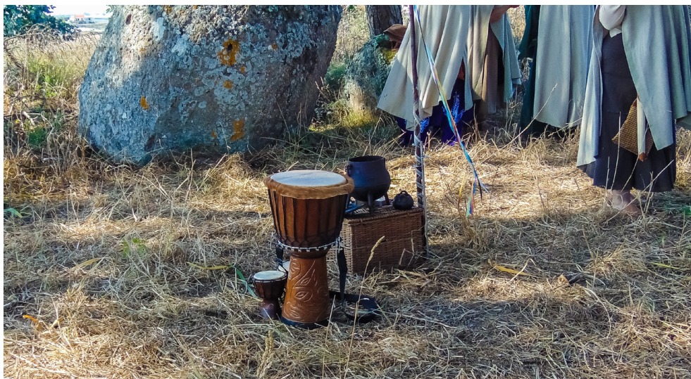
Figura 2 – Celebração do equinócio de outono PFI-Portugal, setembro de 2018, Sintra, Portugal.

Depois de o espaço ser preparado, os membros juntaram-se em círculo, o altar no centro, e o rito começou. Por norma, um ritual pagão começa já com a preparação do espaço onde vai ocorrer, seja a limpeza física e energética do espaço, seja a construção do altar, assim como a purificação dos participantes, que pode ser realizada recorrendo ao uso de incenso, água ou óleos. De seguida, dá-se a abertura do espaço sagrado invocando os quadrantes, ou seja, o Norte, Sul, Este e Oeste, que funcionam como os protetores do espaço; são invocadas ainda as divindades tutelares daquele rito, escolhidas por serem arquétipos de uma determinada energia, que neste caso eram divindades associadas à Terra. O ritual desenvolve-se com preces e cânticos, que neste caso eram as palavras de ordem da Marcha pelo Clima. Como mais tarde me explicaram os responsáveis da PFI-Portugal, estas foram utilizadas para recuperar a energia que tinha sido produzida por todas as pessoas que as entoaram naquela tarde, juntá-la à energia dos membros da associação que estavam naquele momento a criar e a produzir poder para que a sua intenção fosse respondida. Esta intenção manifestou-se na prece final, enquanto as pessoas de mãos dadas rodavam no círculo, entoando: