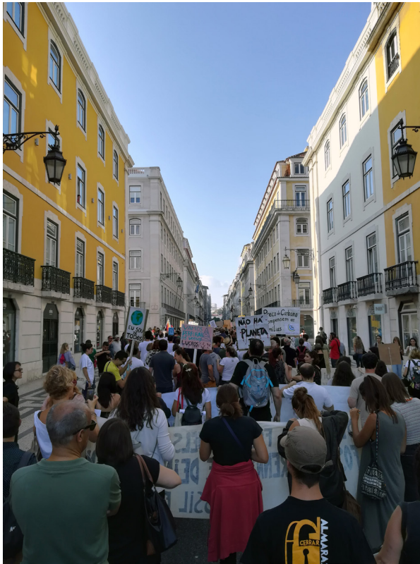
Figura 1 – Marcha pelo Clima, 8 de setembro de 2018, Lisboa, Portugal.