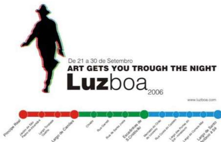
Figura 1 ▶ Banner con el recorrido del festival en 2006. Indicando las diferentes instalaciones en el espacio urbano lisboeta