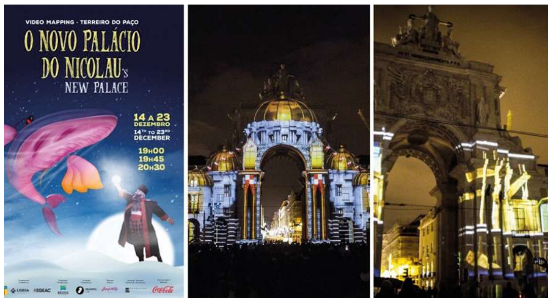
Figura 2 ▷ Izquierda, cartel del video mapping O Novo Palácio do Nicolau . Centro y derecha, imágenes de las proyecciones en la fachada del arco de la victoria en la Plaza de Comercio, Lisboa