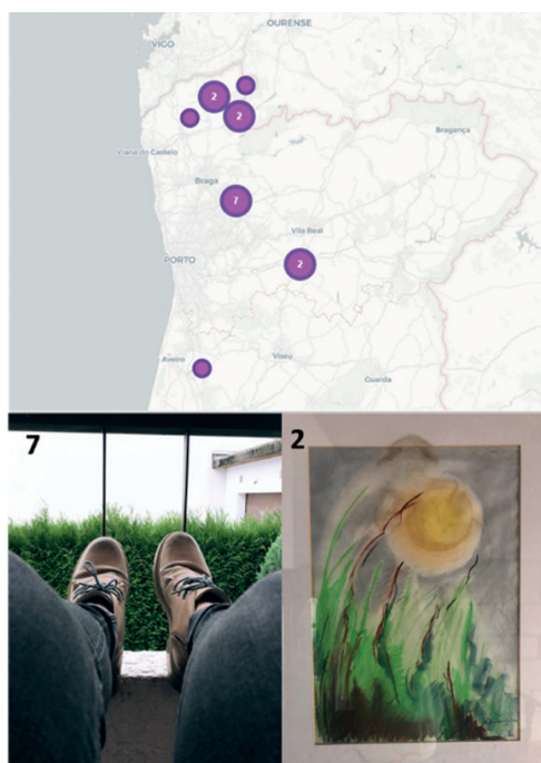
Figura 2 ▶ Os afectos de “J” ilustrados através da aplicação

7: muito confortável; paz, tranquilidade, origem [liberdade, paz de espírito, retiro]; muito confortável; “arte, pintura de família, campo, sol, tranquilidade” [conforto de estar na casa de família, natureza reflexão]