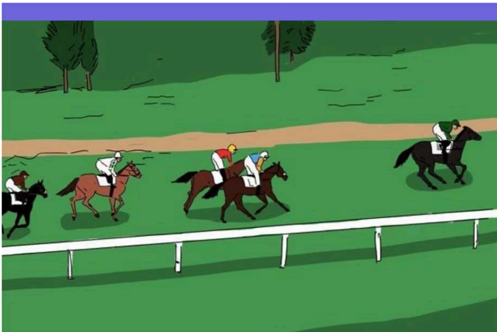
Figura 4: “The Revenant, número 8, remonta y saca ventaja...”