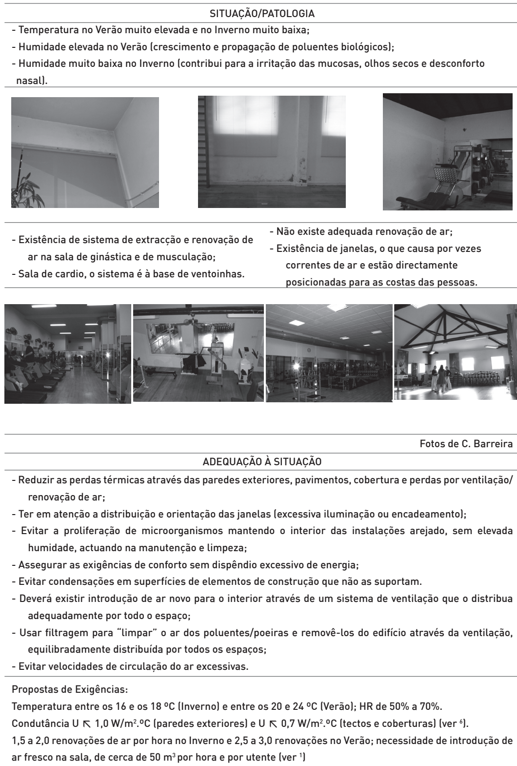
Tabela 8: Situação geral relativa à higrotérmica (com exemplos e propostas de exigências).

A realidade portuguesa do conforto em instalações de fitness . O que mudar? Carla C. Silva Barreira e António P. Oliveira Carvalho