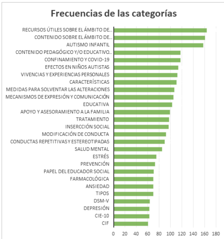
Figura 2: Frecuencias de las categorías.

En la Figura 2 se presentan las frecuencias por categorías. En el enlace https://cutt.ly/JbEkQaG se recogen las categorías y el análisis desarrollado.