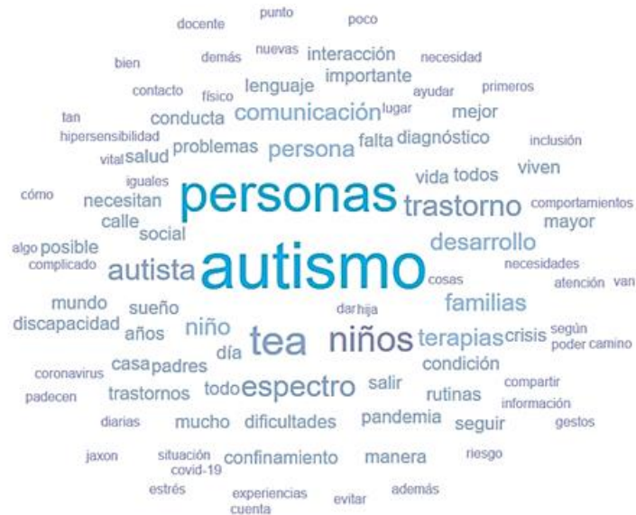
Figura 3: Nube de palabras.