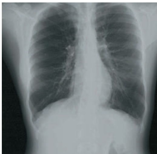
Fig. 2 – Telerradiografia do tórax: Escoliose dorsal de concavidade direita; hiperinsuflação bilateral; rarefação parenquimatosa periférica.

(Quadro I). A gasimetria em ar ambiente e em repouso apresentava insuficiência respiratória parcial com alcalose respiratória (Quadro II). Na tomografia axial computadorizada