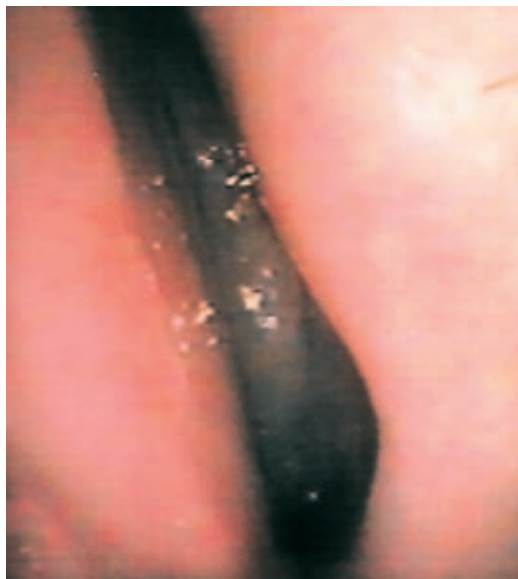
Fig. 1 – Pólipo nasal com exteriorização pelo orifício nasal anterior.