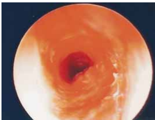
Fig. 1 – Broncoscopia rígida (Novembro 2006) – estenose traqueal, com marcada redução do lúmen a cerca de 25% do total, envolvendo a parede da traqueia e ocupando três anéis traqueais, com abundante tecido de granulação