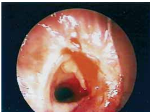
Fig. 5 – Broncoscopia rígida (Outubro 2006) – estenose traqueal em anel fibroso, com abundante tecido de granulação, com redução do lúmen a cerca de 30% do total, ocupando dois anéis traqueais