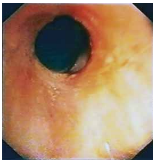
Fig. 4 – Broncoscopia (Maio de 2008): franca melhoria da estenose, lúmen da traqueia com cerca de 60% do total, sem tecido de granulação. Franca melhoria dos sintomas, apenas com estridor ligeiro com o esforço

micina C na concentração de 0,4mg/ml. Efectuada aplicação tópica no local da estenose traqueal e tecido de granulação, com algodão envolvido em estilete metálico longo e embebido na solução de mitomicina C. A aplicação é feita com controlo visual de lupa terminal e durante 2 minutos. Posteriormente, foram efectuadas lavagens com algodão humedecido em soro fisiológico aplicado no mesmo estilete, para remover os possíveis restos do fármaco no local da aplicação.