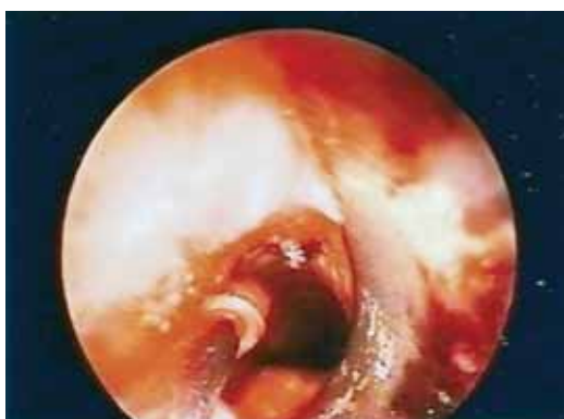
Fig. 3 – Broncoscopia rígida (Junho 2007): após dilatação com broncoscópio rígido 8,5mm e laser , franca melhoria do calibre traqueal (70% do normal). Aplicação de mitomicina C tópica, com algodão em estilete metálico, na zona de estenose traqueal e tecido de granulação, seguida de lavagem com algodão embebido em soro fisiológico

Em face das recidivas da estenose por extensa granulação, optou-se por efectuar terapêutica tópica com mitomicina C em Junho de 2007 (Fig. 3). Esta terapêutica foi aprovada pela comissão de ética da instituição. Foi utilizada solução tópica de mito-