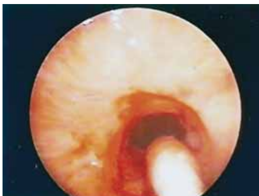
Fig. 6 – Broncoscopia rígida (Março 2008): após dilatação mecânica com broncoscópio rígido 8,5mm, aplicação de mitomicina C, de acordo com a técnica descrita, na zona de estenose traqueal e tecido de granulação

No entanto, o doente evoluiu com recorrência dos sintomas e em broncoscopias subsequentes foi constatada formação de abundante tecido de granulação e reestenose, mantendo necessidade de novas dilatações. Efectuada broncoscopia rígida para nova dilatação e terapêutica com mitomicina C tópica em Março de 2008 (Fig. 6), de acordo com o protocolo já descrito.