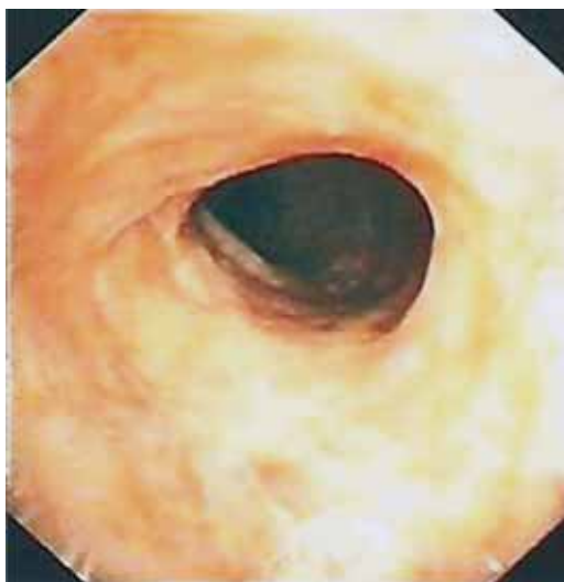
Fig. 7 – Broncoveidescopia (Dezembro 2008): franca melhoria da estenose traqueal com calibre de 70% do lúmen normal da traqueia, sem tecido de granulação

tuição das cirurgias reconstrutivas, uma vez que apresenta menos complicações e menor morbidade 8 . As técnicas endoscópicas permitem ainda, se necessário, procedimentos repetidos com uma maior tolerância do doente. Foram descritas várias técnicas endoscópicas, como dilatação mecânica, mi-