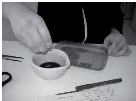
Figura 2 – Tratamento das sementes de canafístula com o extracto de espirradeira.

As sementes foram mergulhadas no extracto durante o tempo e nas concentrações apropriadas, sendo, posteriormente, colo-