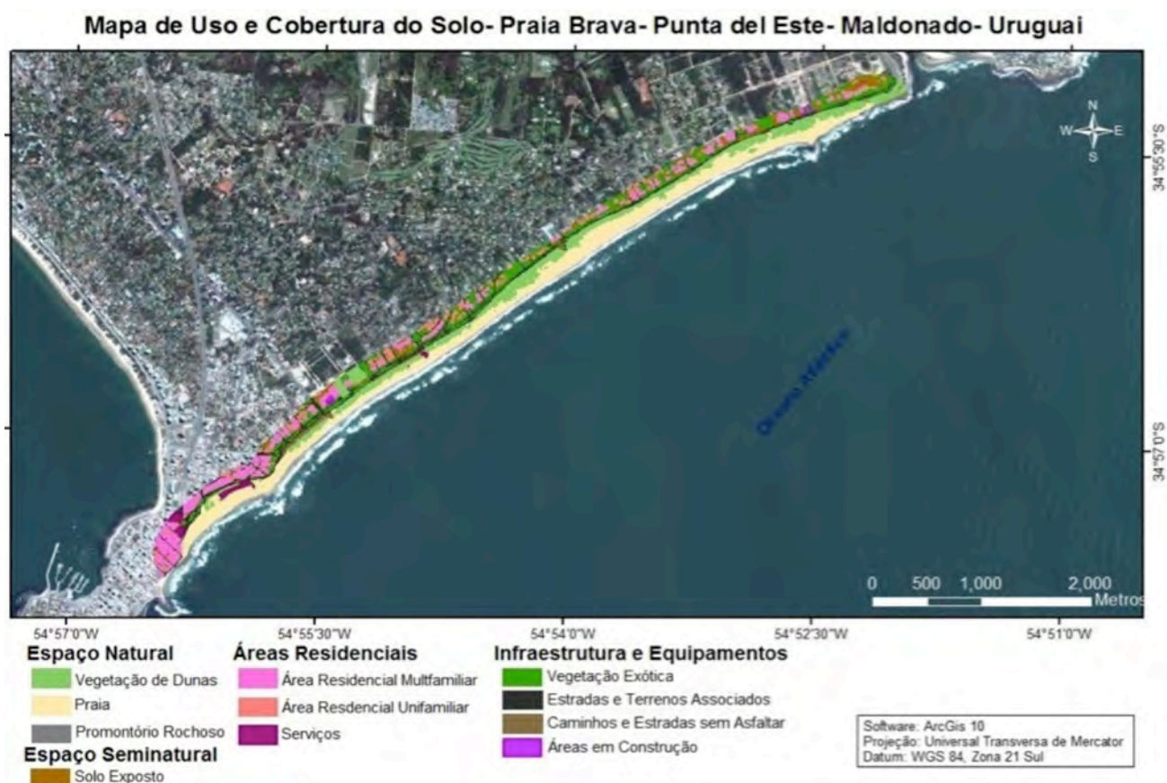
Figura 3 - Mapa de uso e cobertura do solo para a praia Brava, Punta del Este, Maldonado, Uruguai.