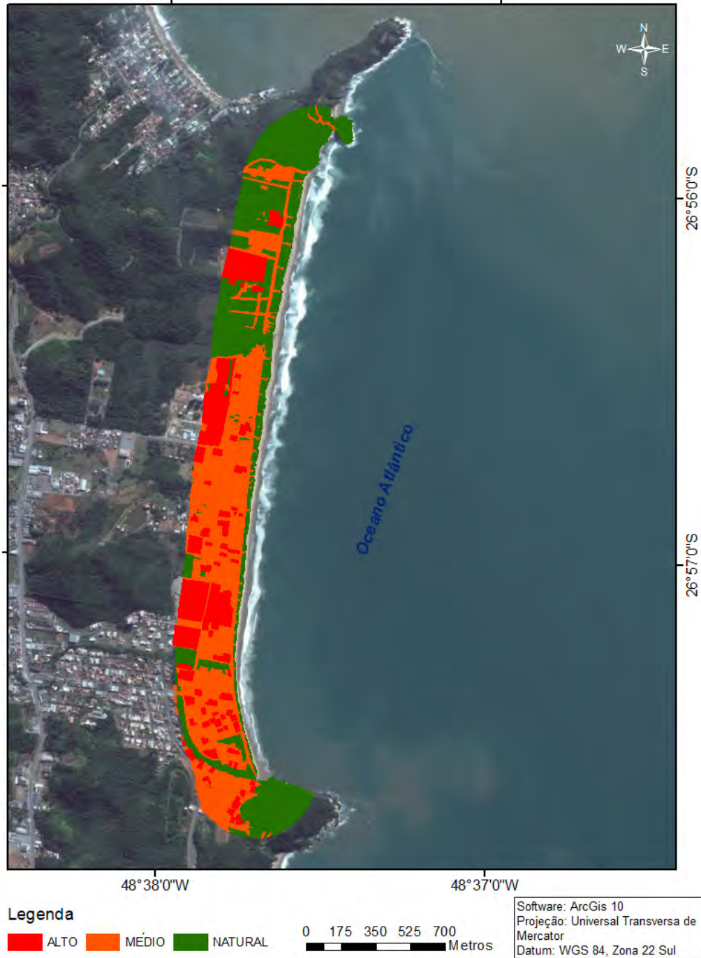
Figura 4 - Mapa do grau de artificialização para a praia Brava, Itajaí, Santa Catarina, Brasil.