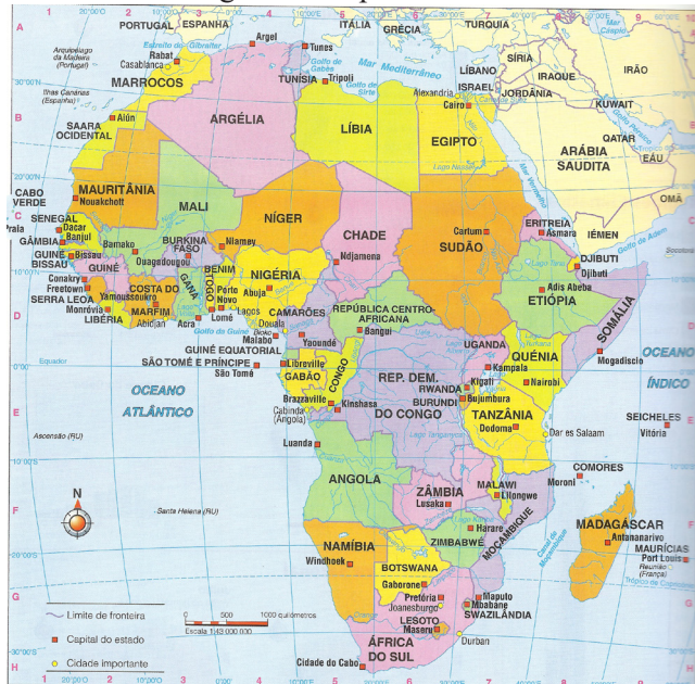
Figura 1: Mapa de África