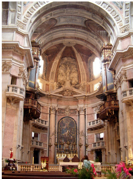
Figura 1. Basílica de Mafra, Capela-Mor.

Aparentemente, Machado e Cerveira deu atenção especial aos dois órgãos da Capela-Mor (Figura 1). Estes instrumentos eram originalmente muito menores do que hoje, porque a existência de uma parede de pedra por detrás das tribunas não permitia um someiro suficientemente profundo. Cerveira tentou resolver esse problema colocando o someiro secundário (someiro de cheios) dois metros acima do someiro principal. Embora essa solução fosse – e ainda seja – menos favorável