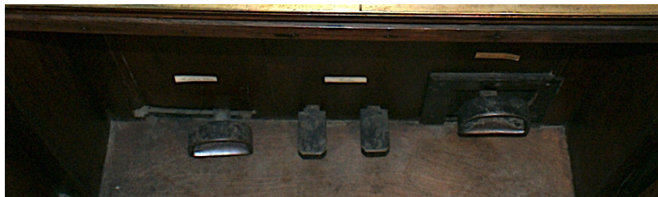
Figura 2. Basílica de Mafra, órgão do Evangelho | Pormenor dos pedais de anulação de cheios (esquerda) e de palhetas (direita).

Este pedal tem quatro posições diferentes, permitindo que o executante alterne entre as palhetas suaves de ressonador curto e a trombetaria horizontal, ou use ambas (ou nenhuma), sem levantar as mãos do teclado.