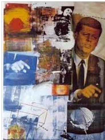
Figura 6. Robert Rauschenberg (1925-2008) - Oil and silkscreen ink on canvas/tinta a óleo e serigrafia sobre tela, 96 x 72 in. (243.8 x 183.8 cm.), 1964.