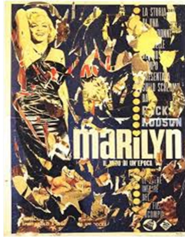
Figura 7. Mimmo Rotella; Marilyn ; Décollage ; 1963; 1,90 x 1,32; Galeria Stein. Fonte: Argan, 1992.

Relaciono as Maculaturas de Lotus Lobo com os Décollage de Mimmo Rotella. Lotus observou as impressões sobre impressões de várias marcas, letras, cores e molduras, vários desenhos e produtos e várias histórias nas Maculaturas das casas de impressão comercial, transparecendo nas chapas de flandres, por meio das sucessividades de marcas, o que foi impresso antes. Mimmo Rotella nota, de certa forma, o contrário, ao olhar para os cartazes publicitários que são colados um sobre o outro e arrancados e rasgados pela população em um gesto instintivo e que revelam o que está por baixo, descobrindo várias imagens, figuras e imagens que estavam cobertas e vários fragmentos das letras, como Argan destacou: