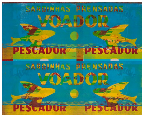
Figura 3. Lotus Lobo - sem título – da Estamparia Litográfica Maculatura sobre folha de flandres. Litografia - 1970/2018.

Todos citados por Massin, monges, grafistas, litógrafos, pintores, fecharam o caminho que parece levar, naturalmente, da primeira a segunda articulação, da letra à palavra, e tomaram outro caminho, que é o caminho da não linguagem, mas da escrita, não da comunicação, mas da significância: aventura que se situa à margem das pretensas finalidades da linguagem, e, justamente por isso, no centro de sua ação (Barthes, 1990, p. 94).