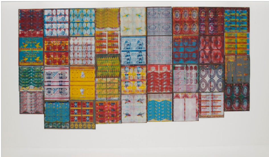
Figura 1. Painel de Maculaturas exposto na Galeria de Arte do Centro Cultural Minas Tênis Clube ( Fonte: Exposição Litografia Lotus Lobo - Galeria de Arte do Centro Cultural Minas Tênis Clube – 17 de outubro de 2018 a 02 de fevereiro de 2019 – Belo Horizonte/ Minas Gerais. Coleção da artista e coleções particulares).

Para a artista a apropriação das Maculaturas, era “um resgate de imagens que perder-se-iam no lixo. São gravuras completas, mesmo criadas por acaso” (Lobo, 2001, p. 24).