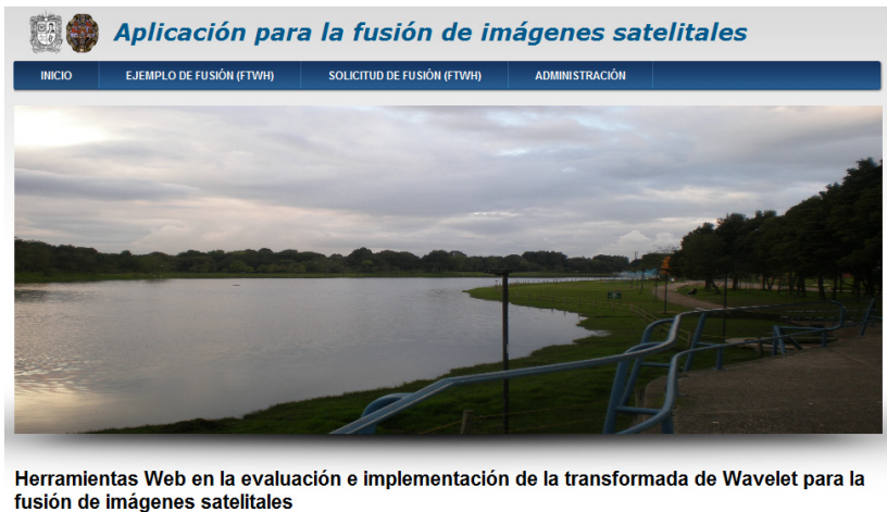
Figura 2. Interface de la implementación web (Mashup) para la fusión de imágenes satelitales.

El en modulo de “inicio” Figura 2 se encuentra una introducción de la fusión de imágenes satelitales, el objetivo general, el planteamiento de la investigación y la justificación de la investigación.