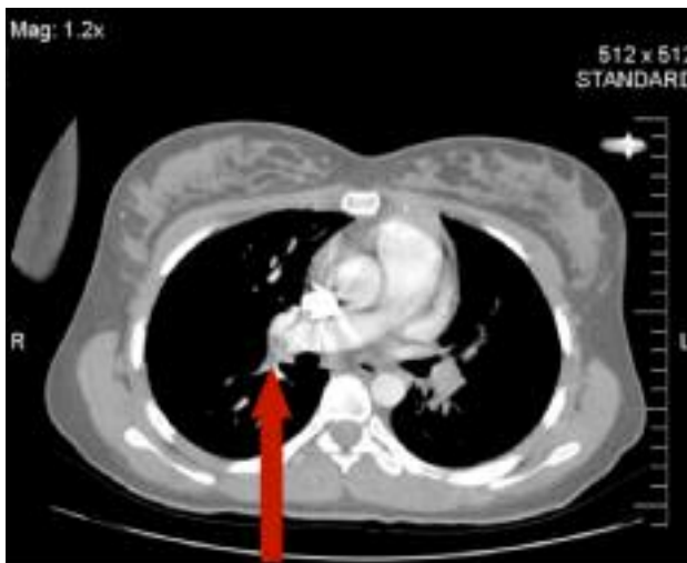
Figura 2. Imagem de TC contrastada do tromboembolismo pulmonar (mais evidente à direita – seta) em 26/08/2006.

Após internamento ficou medicada com enoxaparina (80mg de 12/12h).