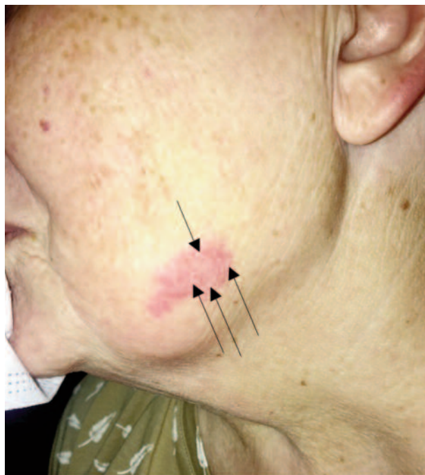
Figura 3. Lesão eritematosa na região mandibular esquerda com esboço de vesículas.

Devido à escassa quantidade de literatura sobre este tópico não existem linhas orientadoras que auxiliem a