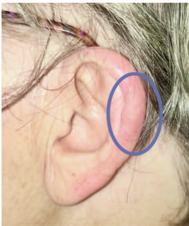
Figura 2. Exantema na hélice do pavilhão auricular esquerdo, visto de perto, com destaque para a região onde se podem observar as vesículas milimétricas.

sionais de saúde para as diferentes apresentações de HZ.