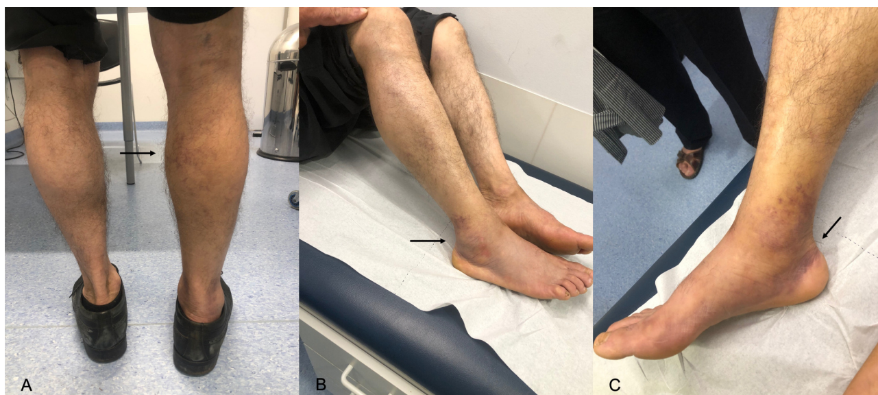
Figura 2. A) Vista posterior: edema maleolar e presença de equimoses na fossa poplíteia com 10x15 mm e na região gemelar direita (seta); B) Vista lateral: equimoses na região maleolar externa (seta); C) Vista medial: equimoses na região maleolar interna ( signal do crescente – seta).