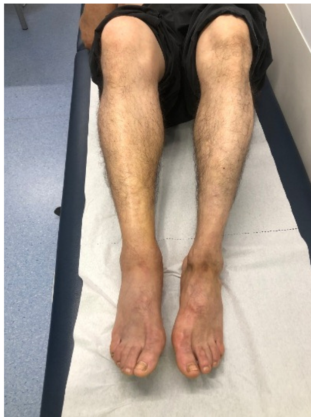
Figura 1. Vista anterior: edema da perna direita.

À observação destacava-se edema da perna direita até ao joelho (Figura 1), notando-se a presença de equimoses com diâmetros entre 5 e 10 mm nas regiões maleolares interna e externa e região gemelar. Observava-se também, na fossa poplíteia, uma equimose com 10x15 mm (Figura 2). Apresentava agravamento da dor à palpação das regiões poplíteia e gemelar direitas e dor na região poplíteia à flexão do joelho. Encontrava-se hemodinamicamente estável e apirético. Auscultação cardíaca e pulmonar sem alterações. Sem rubor ou calor locais, sem empastamento gemelar e sinal de Homans negativo (sem dor à flexão passiva e rápida do pé sobre a perna). Mobilização da articulação tibiotársica sem limitação e teste de Thompson, para avaliar rotura do tendão de Aquiles, negativo (presença de flexão plantar aquando da compressão da região posterior da perna com o doente em decúbito ventral e o joelho em extensão sobre