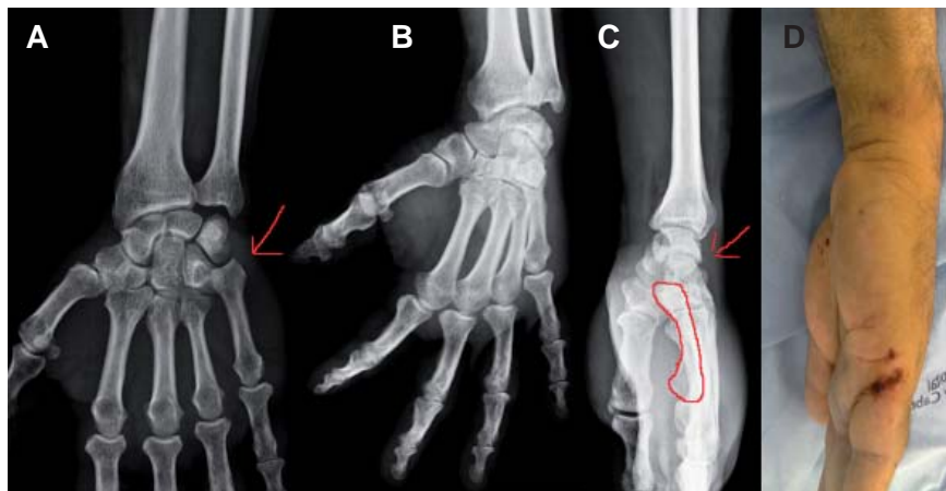
Figura 2. Radiografias na admissão A) antero-posterior, B) oblíqua a 30°, C) perfil e D) imagem da deformação apresentada no pré-operatório, sendo visível o desvio proximal e palmar do 5º metacarpico.