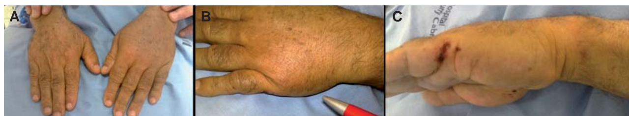
Figura 1. Imagem pré operatória A) ambas as mãos, B) mão esquerda, C) perfil da mão com evidente deformação palmar.

Aos 6 meses apresentava-se sem dor, com mobilização total do punho, mão e dedos. O Score Dash era de 0.8 (Figura 4).