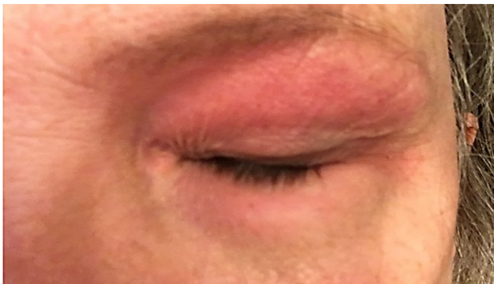
Figura 2 - Flushing exclusivamente periorbitário.