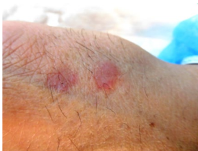
Figura 2 - Um nódulo e várias pápulas confluentes, eritematosas, no dorso da mão esquerda.