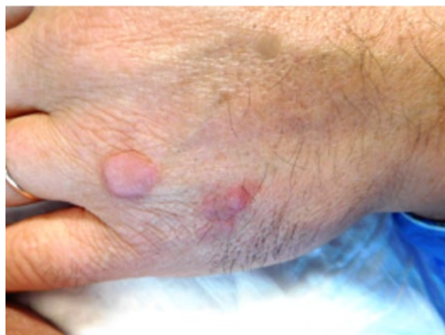
Figura 1 - Nódulos eritematovioláceos, de consistência dura à palpação, esboçando bordos elevados na mão direita.

Perante as hipóteses de diagnóstico de eritema elevatum diutinum , de granuloma anular e de ACM, foi realizada biópsia cutânea que mostrou, na derme superficial e média, proliferação de pequenos vasos, de parede fina, rodeados por uma camada de pericitos. Na derme circundante, observam-se células multinucleadas e angulosas, em estroma de colagénio espessado (Fig. 3), características típicas de ACM, diagnóstico que foi assumido.