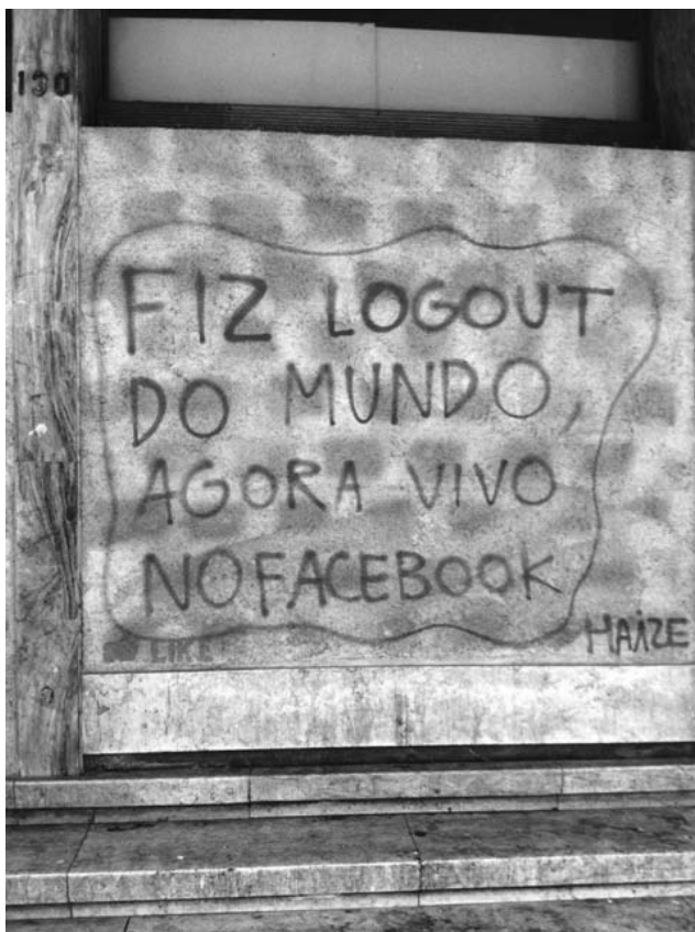
Avenida Almirante Reis, Lisboa

(Mark Zuckerberg, Califórnia, 17.11.2010)