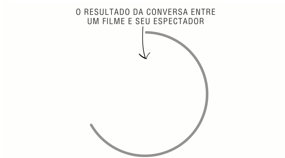
Figure 3: A esfera aberta da liberdade

entre um filme e o seu espectador (Figure 3). E este pode ser extraordinário quando os entendimentos não-formal e formal, enfim, fundamentam uma esfera que se rompe e torna-se aberta: a possibilidades infinitas, a uma experiência única de liberdade.