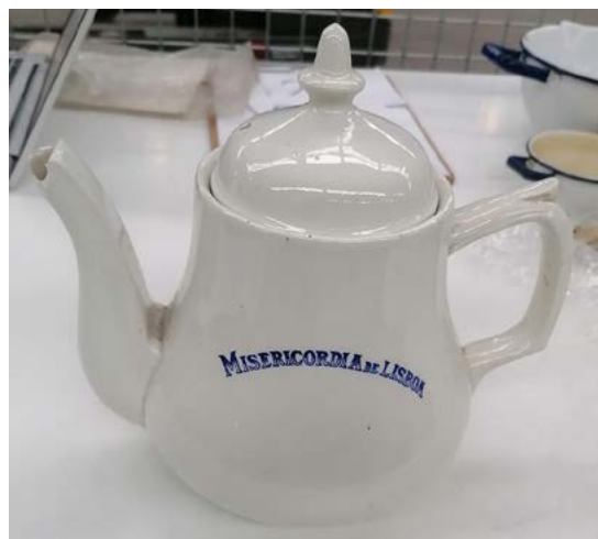
Figura 4 Duas peças com a inscrição da Misericórdia a azul. Identificadas no catálogo de formas da Fábrica de Loiça de Sacavém com o formato “redondo” (a terrina) e “chinez” (o bule), ambas com selo datado na produção de 1911-1966. Museu de São Roque / Santa Casa da Misericórdia de Lisboa.