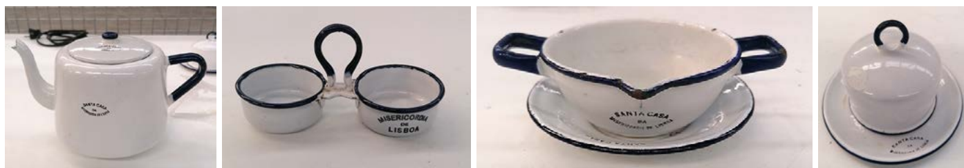
Figura 10 Utensílios em esmalte para uso nas cozinhas económicas: cafeteira, azeitoneira, molheira e manteigueira, décadas de 1930 e 1940. Museu de São Roque / Santa Casa da Misericórdia de Lisboa.

Poder-se-ia pensar que este tipo de equipamento integrava as despesas com os “artigos de uso doméstico”. Todavia, nesta rubrica cabiam antes artigos como vassouras, escadotes, panos, cestas, capachos e afins, sendo que, até 1929, as loiças entravam nos gastos como “mobiliário e utensílios”, rubrica que, entretanto, desaparece e é substituída por uma outra, intitulada “despesas de conservação”. A sua aquisição dependia de um pedido do serviço ao economato, que identificava as necessidades, e se, no caso da loiça em faiança, esta podia ser comprada diretamente à fábrica de Sacavém, já os esmaltes eram adquiridos a um intermediário especializado em loiças de alumínio e esmalte nacionais: referimo-nos a Moura & Vicente, Lda., proprietária da Vidraria Cristal, localizada na rua da Mouraria, em Lisboa. Ambos eram fornecedores regulares da SCML, ainda antes da incorporação das cozinhas económicas 36 , tanto deste tipo de utensílios de cozinha (Figura 10), como de outros orientados para a higiene, como bacios, bidés, tinas e escarradores, além daqueles médico-farmacêuticos, de que também sobrevivem testemunhos no acervo do Museu de São Roque.