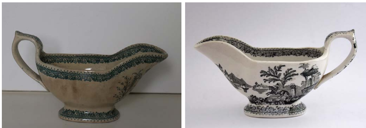
Figura 7 À esquerda: molheira com as armas da Misericórdia de Lisboa, faiança policromada, 1862-1894. Museu de São Roque / Santa Casa da Misericórdia de Lisboa. À direita: molheira, com motivo decorativo da estátua, faiança policromada, séc. XIX. Museu de Cerâmica de Sacavém.

É muito provável que estas peças tenham sido usadas na Provedoria da Santa Casa da Misericórdia de Lisboa, não apenas pela função inerente a uma molheira – cuja utilização se associa a uma refeição mais sofisticada –, mas