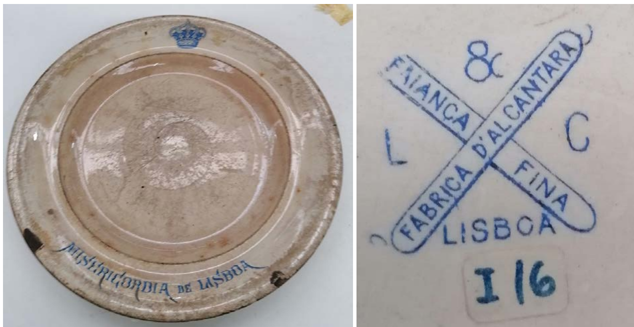
Figura 6 Prato com inscrição da Misericórdia de Lisboa e respetivo carimbo de fábrica, faiança policromada, 1886-1895. Museu de São Roque / Santa Casa da Misericórdia de Lisboa.

série para fábricas e hospitais, também produzia serviços de jantar de diferentes formatos e decorações, passíveis de personalizar, por encomenda, com nomes, datas, heráldica familiar, militar ou institucional. As molheiras são, justamente, um exemplo de uma encomenda personalizada, conquanto se reconheçam paralelos com as demais peças coevas, das quais mantêm o formato e parte do programa decorativo, nomeadamente ao nível das cercaduras, de modelo muito similar ao que acompanha o famoso motivo decorativo da estátua, comumente conhecido como cavalinho, e uma das imagens de marca da Fábrica de Loiça de Sacavém (Câmara Municipal de Loures, 2016).