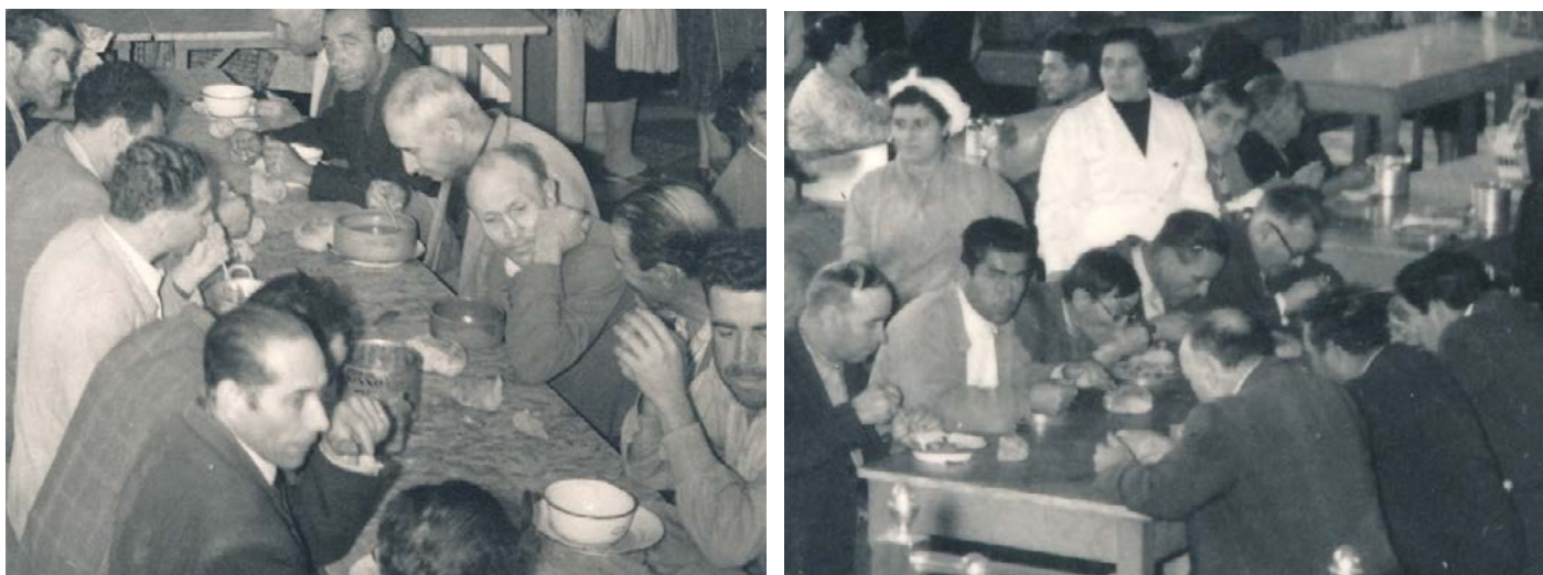
Figura 9 À esquerda: cozinha de São Bento, a distribuição da sopa, pormenor. À direita: cozinha dos Anjos, aspeto do refeitório, pormenor. Fotografias sobre papel, 1959. Arquivo Histórico da Santa Casa da Misericórdia de Lisboa, PT-SCMLSB/ACESP/GA/02/Cx. 001, Cap. 6, fotografias 11 e 29.