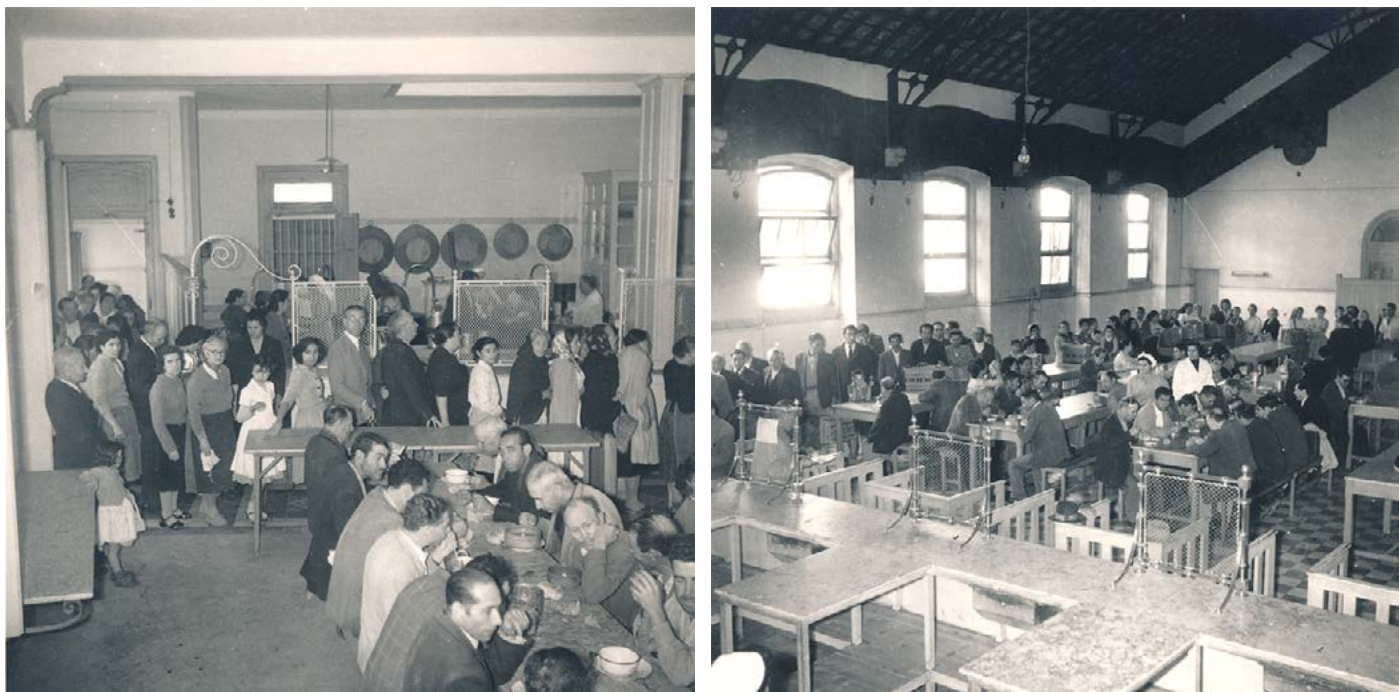
Figura 8 À esquerda: cozinha de São Bento, a distribuição da sopa. À direita: cozinha dos Anjos, aspeto do refeitório. Fotografias sobre papel, 1959. Arquivo Histórico da Santa Casa da Misericórdia de Lisboa, PT-SCMLSB/ACESP/GA/02/Cx. 001, Cap. 6, fotografias 11 e 29.

Algumas fotografias das cozinhas económicas dos Anjos e de São Bento, datáveis de 1959 (Figura 8), permitem reconhecer a presença e uso pelos utentes de tigelas e pratos em esmalte branco com bordo azul-escuro, análogos a peças ainda sobreviventes (Figura 9).