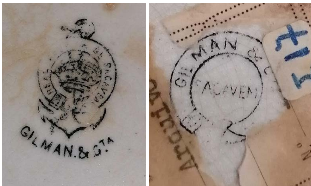
Figura 3 Os dois selos da Fábrica de Loiça de Sacavém presentes nas peças das cozinhas económicas. Museu de São Roque / Santa Casa da Misericórdia de Lisboa.

de sopa, 152 pratos de sobremesa, 43 terrinas redondas, 43 pratos cobertos, 63 jarros, 97 canecas e 23 travessas ovais. Dois meses mais tarde, a SCML volta a pagar nova remessa composta por 29 travessas ovais, 8 terrinas redondas, 2 pratos cobertos redondos, 3 pratos de sopa, 21 ditos de guardanapo, 1 dito de sobremesa, 10 pratos de sopa e 6 canecas. Além desta informação, as faturas consultadas identificam uma parte da louça como sendo de refugo, logo, com pequenos defeitos ou imperfeições quando saídas do forno, pela qual a SCML beneficiou de descontos variáveis, na ordem dos 15, 20 e 30 % na sua aquisição, assim como as dimensões dos pratos e das travessas, em polegadas (pratos de 8 e 7", e travessas de 11 e 13"), pormenor que poderá remeter para a ascendência britânica dos sucessivos proprietários da fábrica e do próprio sistema de produção nela adotado 33 . Do mesmo modo, assinala-se se as peças têm ou não marca, referindo-se à presença de inscrições, ignoramos se alusivas às cozinhas económicas ou somente à Misericórdia de Lisboa, como sucede noutros objetos à guarda do museu 34 .