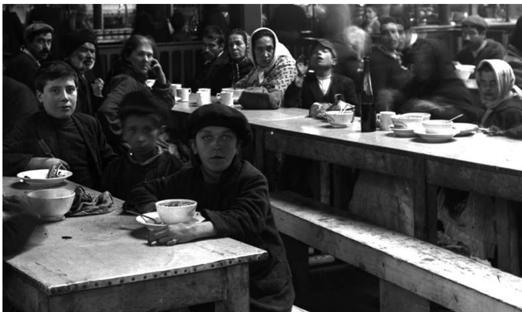
Figura 1 Reabertura das cozinhas económicas, pormenor. Interior de uma das cozinhas económicas, detalhe onde se observam as diversas tipologias de utensílios de faiança. c.1910. PT/AMLSB/CMLSBAH/PCSP/004/JBN/002785.