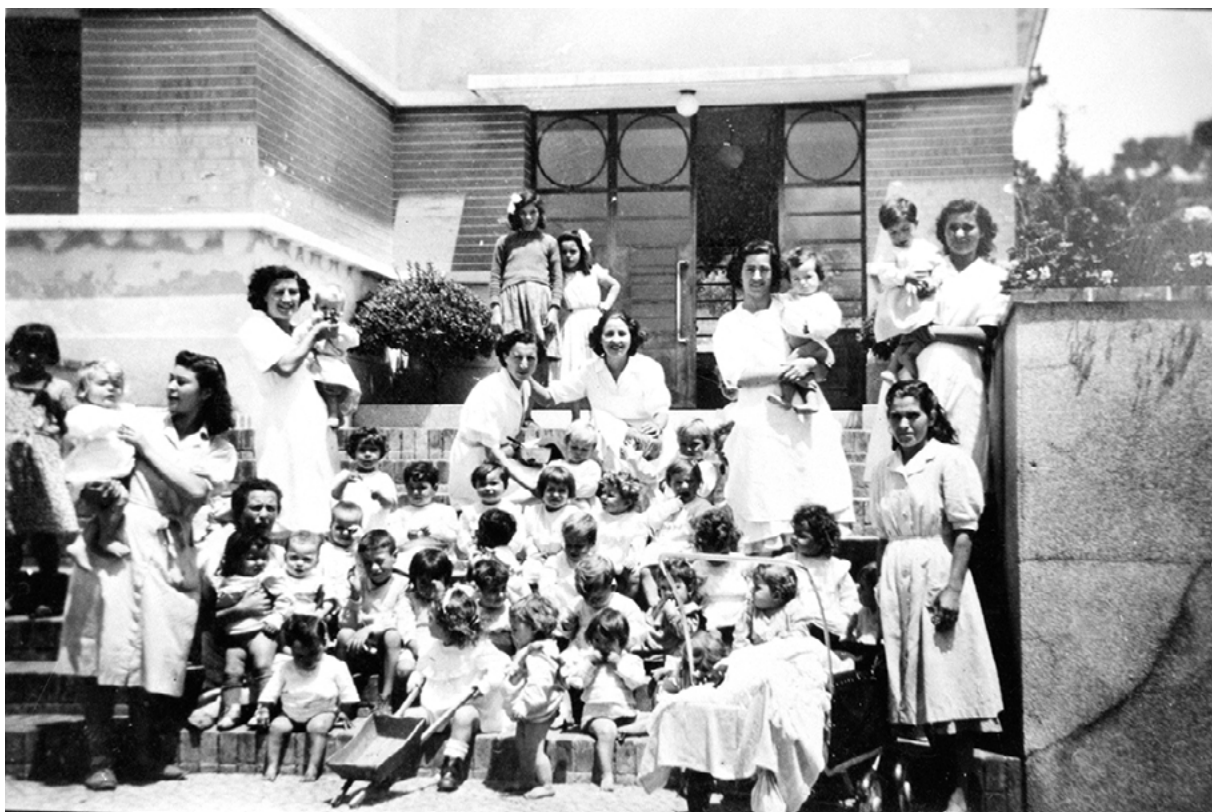
Figura 7 Grupo de crianças e amas junto à casa da infância da fábrica Mundet & C.ª, Lda. no Seixal, [1950?].

Com a instalação dos edifícios da creche e da casa da infância, bem como das respetivas estruturas de apoio – ocupando uma área total de 7525 m 2 (1375 m 2 dos quais de área coberta) –, emergiram as necessidades de murar os equipamentos sociais e a construção de novos acessos.