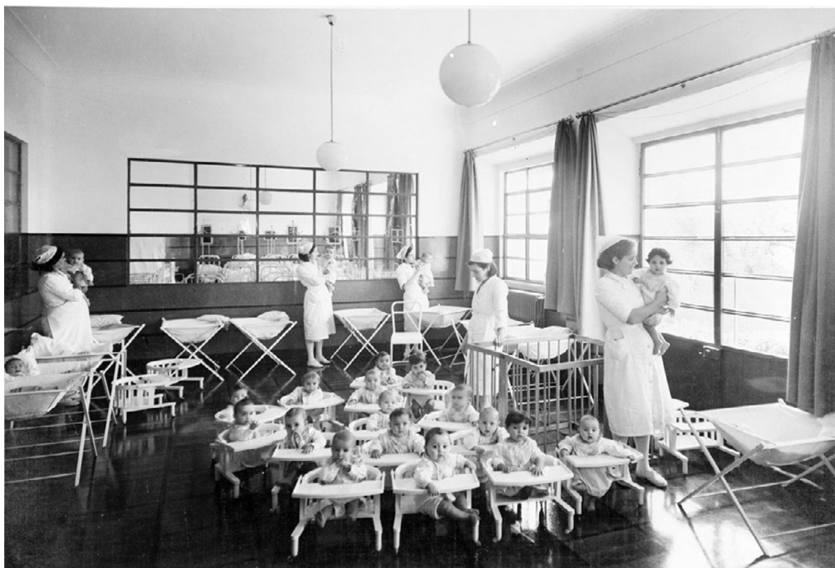
Figura 4 Amas e bebés numa das salas da creche da fábrica Mundet & C.ª, Lda. no Seixal, [1943?].