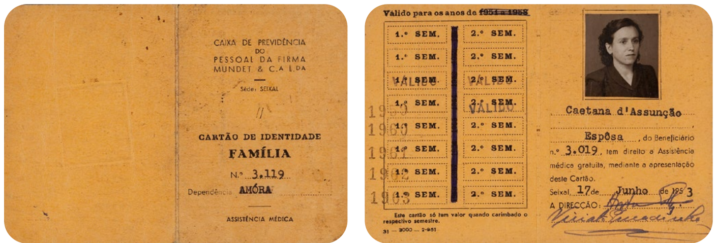
Figuras 8 e 9 Cartão de familiar de beneficiário da Caixa de Previdência do Pessoal da Firma Mundet & Cª Lda. (frente e verso), 1953.

A assistência médica e farmacêutica da Caixa de Previdência foi instalada em 1942 numa sala disponibilizada no posto médico do Sindicato Nacional dos Operários Corticeiros do Distrito de Setúbal, com sede no Seixal 40 . No ano seguinte foram criados postos médicos nas dependências das fábricas do Seixal e de Amora, enquanto nas unidades fabris de Mora e de Ponte de Sor, a assistência médica foi disponibilizada nos consultórios dos próprios clínicos contratados para prestação de cuidados médicos aos trabalhadores 41 .