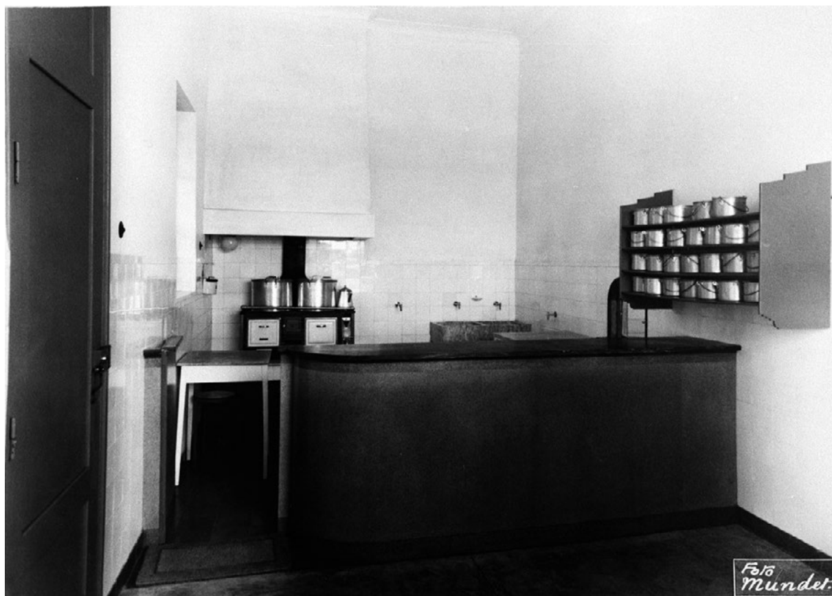
Figura 2 Cozinha da sopa dos pobres instalada junto aos refeitórios da fábrica Mundet & C.ª, Lda. no Seixal, [1940?].