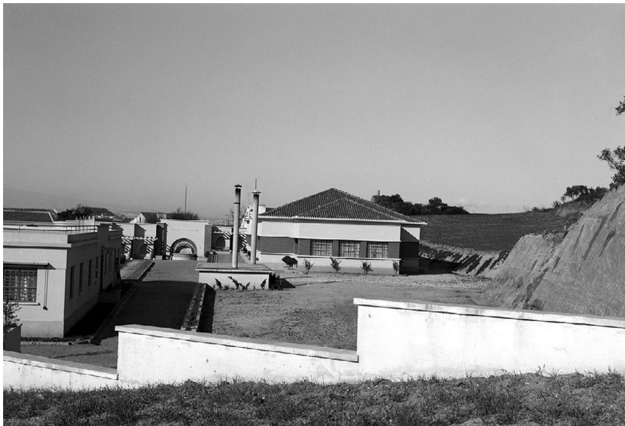
Figura 5 Perspetiva geral das instalações de assistência materno-infantil da fábrica Mundet & C.ª, Lda. no Seixal, 1943.