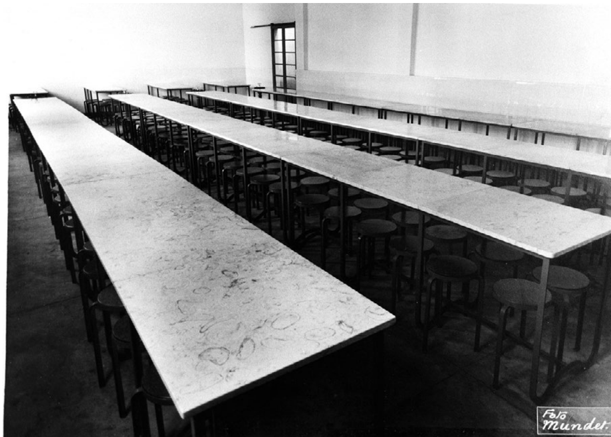
Figura 1 Sala destinada aos operários nos refeitórios da fábrica Mundet & C.ª, Lda., no Seixal, [1940?].

refeições nas bermas da estrada 20 . Outros optavam pela taberna que ficava contígua à fábrica, onde eram servidas refeições frugais à hora do almoço. O taberneiro aquecia-lhes a refeição que traziam de casa, habitualmente composta por sopa, um bocado de chouriço ou de toucinho metido dentro de um quarto de pão escuro. Alguns levavam as sobras do jantar da véspera, uma posta de bacalhau ou um peixe miúdo, acompanhadas por batatas cozidas na taberna. Em troca dos serviços prestados pelo taberneiro, os operários compravam-lhe vinho para acompanhar a refeição 21 .