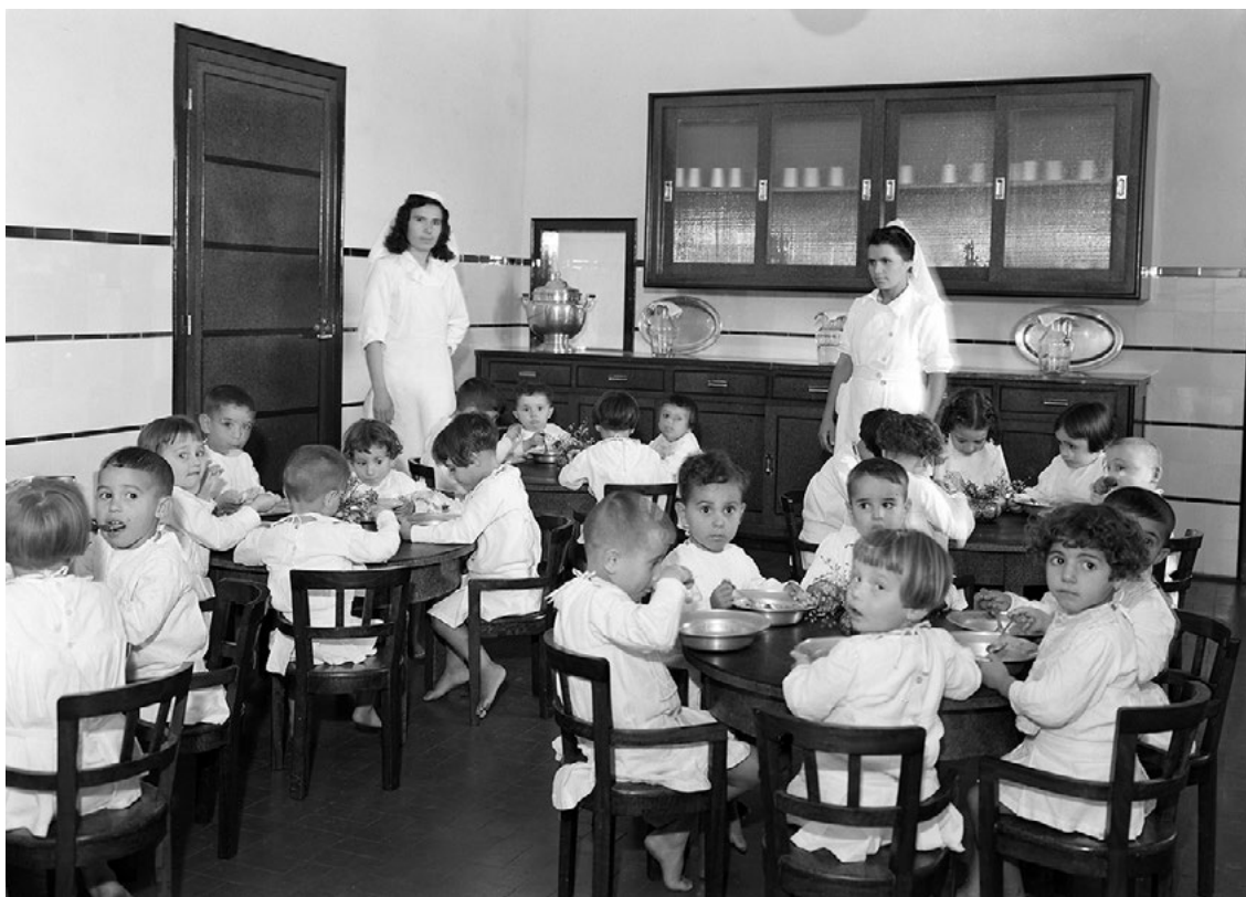
Figura 6 Sala de refeição das crianças da creche e da casa da Infância da fábrica Mundet & C.ª, Lda. em Amora, [1950?].

vacaria 36 ), garantindo alguns dos géneros alimentares essenciais à alimentação das crianças, entre outros, os produtos hortofrutícolas, os ovos, a carne e o leite. A estes juntavam-se, por prescrição do médico assistente, os suplementos alimentares, sobretudo, o óleo de fígado de bacalhau.