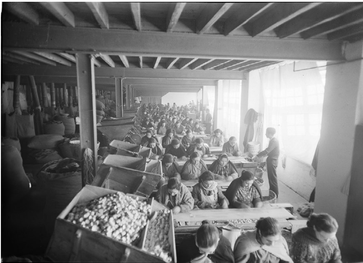
Figura 3 Escolha de rolhas da fábrica Mundet, no Seixal, 1954.

sua primeira creche junto à unidade industrial que detinha na freguesia de Amora, adquirindo no mesmo ano uma propriedade confinante com a fábrica no Seixal, para construção de uma segunda creche no concelho. O seu estabelecimento marca um momento de charneira na história da política social da empresa, com a afetação de verbas e de recursos materiais e humanos que, excedendo o apoio prestado ao seu operariado, visava abranger os respetivos agregados familiares 24 (Figura 4).